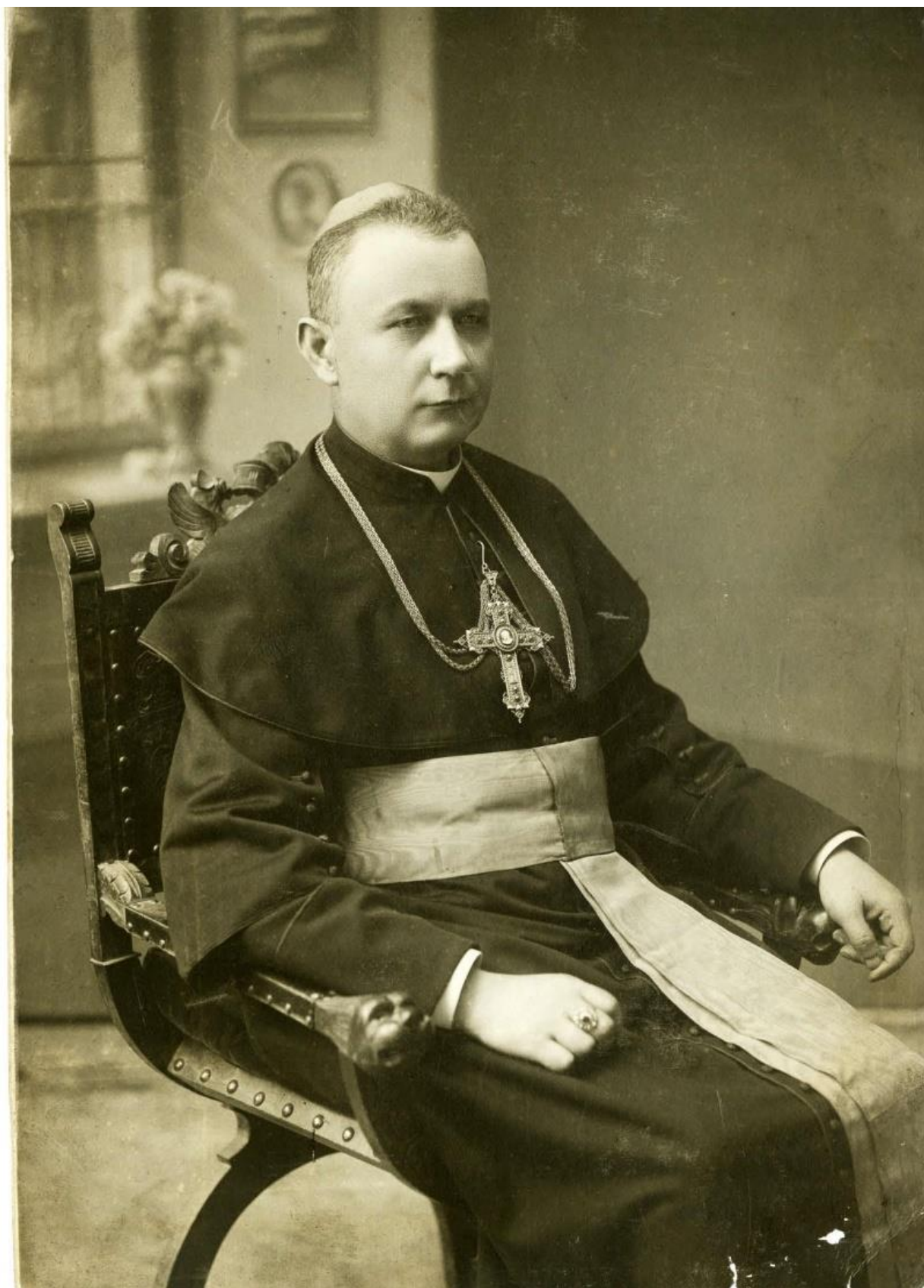
Рис. 1.1. Блаженніший Григорій Хомишин