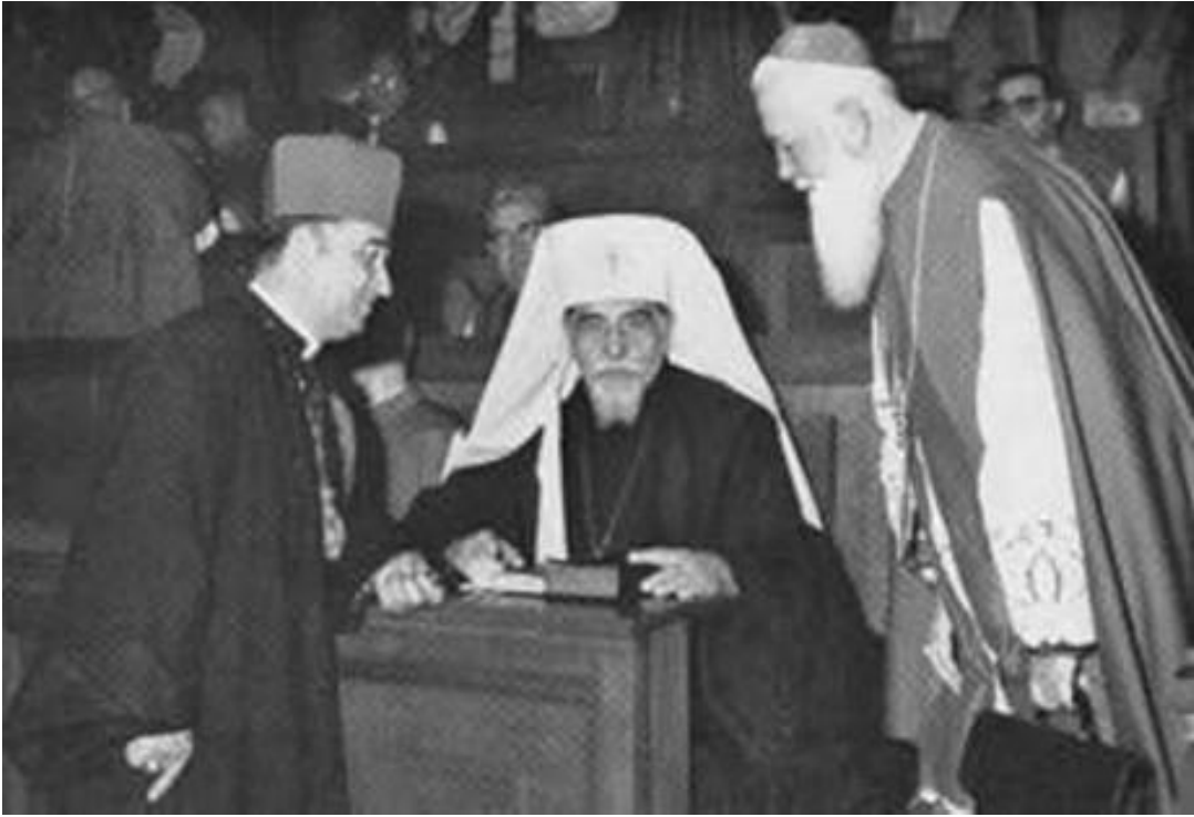
Додаток В. Йосиф Сліпий під час Другого Ватиканського Собору.