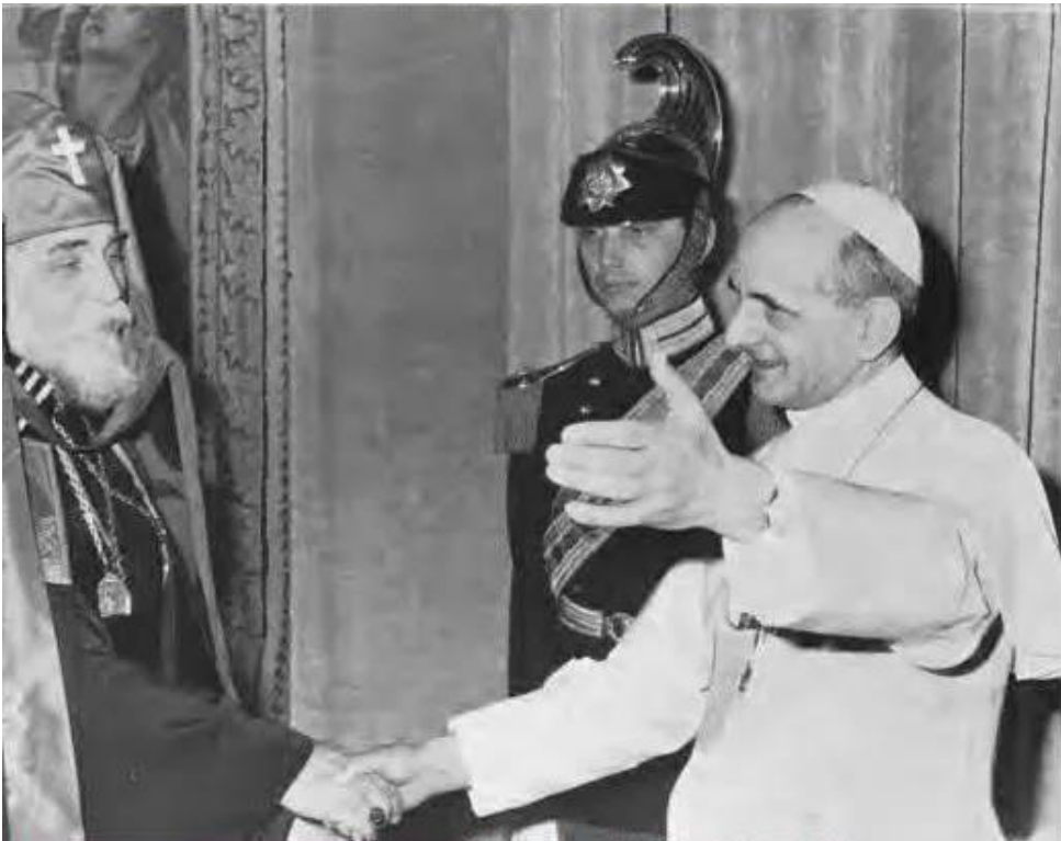
Додаток Г. Йосиф Сліпий і Папа Павло VI, 1965 р.