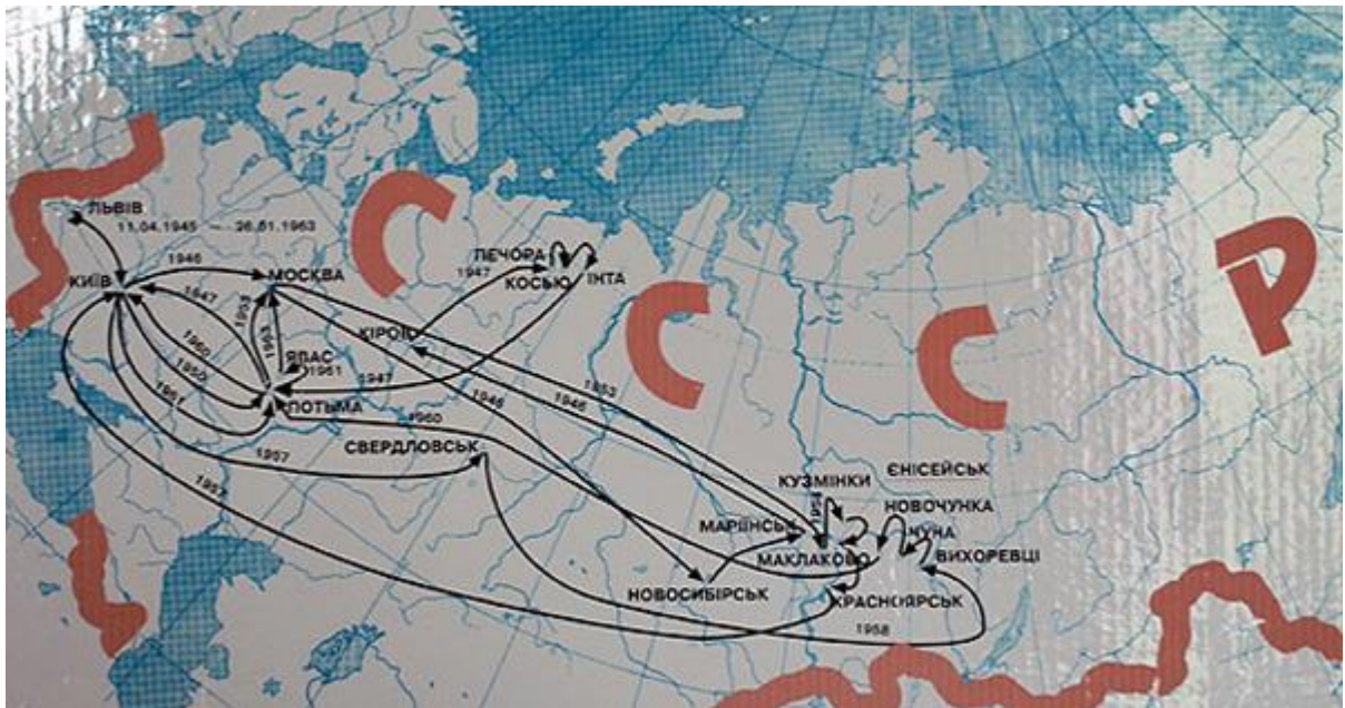
Додаток Б. Переміщення Йосифа Сліпого під час 18-річного заслання