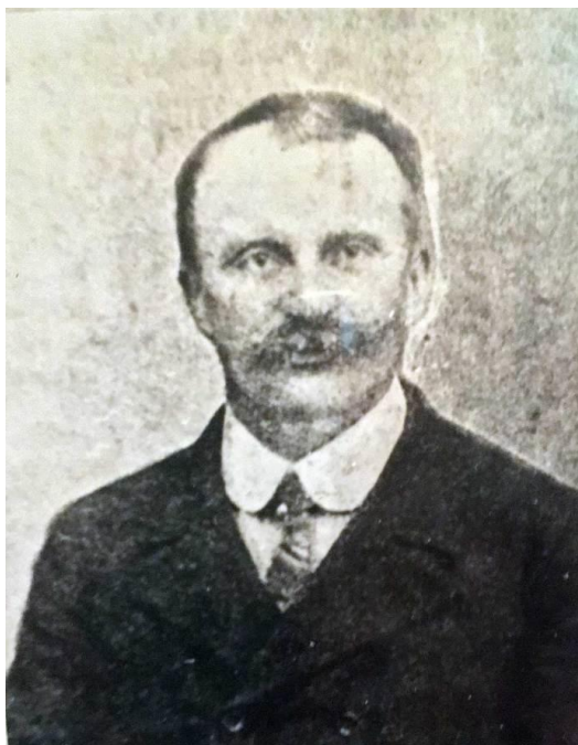
Фото з експозиції Літературно-меморіальний музей Івана Франка в с. Криворівні