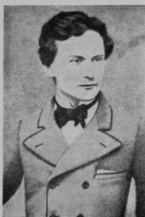
Іван Франко в 1875 році

Того року Франко був сам, а може з хлопцями і мейжак у нас на приходили. Коли ж був з усією сім'єю, то гриби збирали з собою, і їх готувала його дружина. Вони мешкали проти нас, на другому