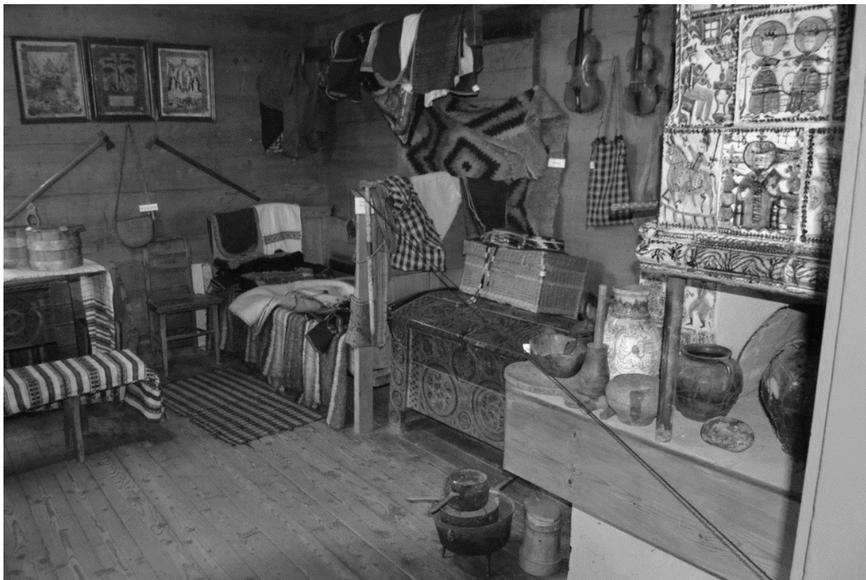
Фото Євгена Червоного, 2021 р.

Кімната, у якій мешкав Іван Франко у Криворівні в хаті Василя Якіб'юка. Сьогодні – фрагмент експозиції Літературно-меморіального музею у с. Криворівні.