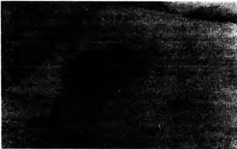
Фото 1. Наземне житло XII – першої половини XIII ст. з поселення Пуста Чорнівка

Матеріали розкопок свідчать, що селянське домобудування принципово не відрізнялося від міського. На відкритих поселеннях досліджені всі відомі типи жител (напівземлянки, наземні житла). Останні досліджені на Пустій Чорнівці, Вікні, Горечі, Грозинцях, Добринівцях, Дорошівцях, Недобоївцях, Онуті тощо [6, с.32–43; 31; 32]. Напівземлянки відомі внаслідок розкопок у Карапчеві, Онуті Перебиківцях, Добринівцях та ін. У зв'язку з тим, що відкриті поселення практично не досліджувалися, про характер домобудування ми здебільшого можемо робити висновки за розвалами печини, черенів та темних плям із культурним шаром (залишків жител). З наявних у нашому розпорядженні матеріалів відомо, що давньоруські житла на поселеннях були зрубної конструкції. Нижні колоди споруд лежали безпосередньо на землі без будь-якої субструкції. У кожному житлі не було відзначено ні слідів стін, ні кутових “стільців”, ні завалів глини (фото 1).