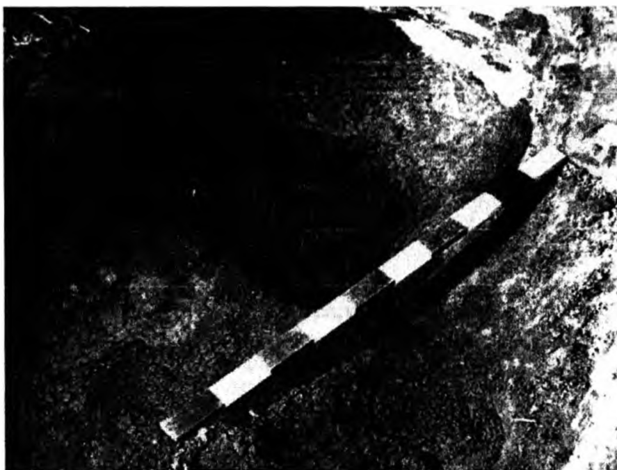
Фото 2. Господарська яма з поселення Пуста Чорнівка

У більшості випадків знайдено жіночі прикраси в основному як поховальний інвентар. Так, на поселенні Маморниця в урочищі Лутарія виявлені срібні сережки та срібний позолочений бубонець (рис.2, 13, 15). На поселенні Дорошівці в урочищі над Дністром виявлене золоте скроневе кільце, а в с. Митків – у похованнях срібні скроневі кільця, мідна сережка та металева намистина бочкоподібної форми (рис.2, 16, 17) [30; 34, с.166]. Скроневе срібне кільце походить також з Онута [29]. У с. Санківці розкопане жіноче поховання із залишками чільця, до складу якого входило 6 бронзових позолочених