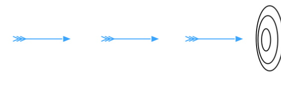
Рис. 2. Апорія «Стріла»

«кривду на самоті» 58 , або почасти громадянському рівноправ'ю в обмін на етнічне самозречення, у будь-якому разі – на етнічну самотність, нерухомість в досягненні цілі, компромісу. Інша справа, що і українці, і євреї у хроніці своїх етнополітичних контактів і співпраці завжди займали рівне собі місце, трактували себе навзаєм партнерами, однак майже не виходили за границі етнічних гетто («Це були лише прояви зближення та порозуміння, а також взаємного національного інтересу» 59 ). Цікаво, що тим «луком», з якого вилітала «Стріла», завжди (у випадку нашого хронотопу) був австрійський конституціоналізм / парламентаризм – у межах якого й розгорталася міжетнічна взаємодія. Проілюструвати цю Зенонову апорію можна так (Див. Рис. 2):