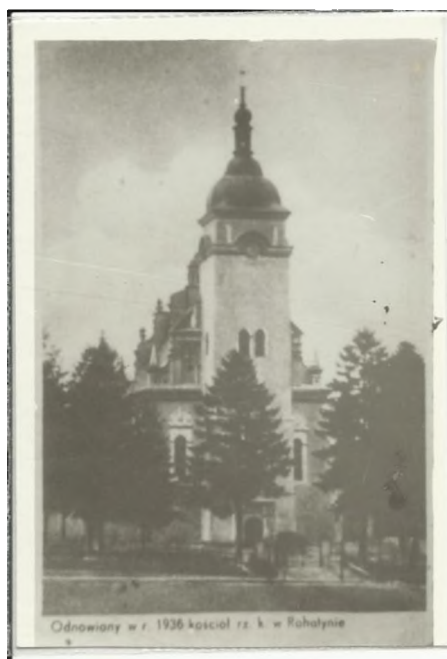
Іл.2. Костел Святого Миколи Єпископа, м. Рогатин. Фото 1936 р. (Із архіву М.Воробця).