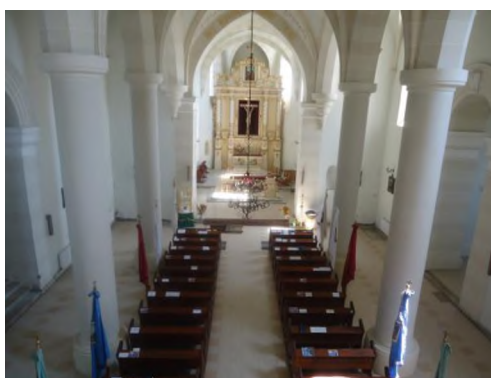
Іл.3. Костел Святого Миколи Єпископа, місто Рогатин. Інтер'єр. Фото 2013 р.