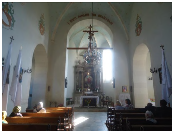
Іл.8. Костел Всіх Святих, смт. Букачівці Рогатинського р-ну Івано-Франківської обл. Інтер'єр. Фото 2013 р.