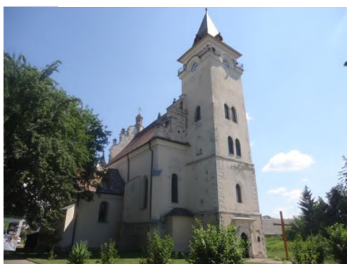
Іл.1. Костел Святого Миколи Єпископа XVI-XVII ст., м. Рогатин. Вигляд з північного заходу. Фото 2013 р.

особливості, притаманні костельному будівництву в Галичині XVI–XVIII століть: однобаштовий фасад, асиметричне планування, готичні елементи, компактна композиція фасаду, гостроверхі дахи. Розкриті на стінах рогатинського костелу фрагменти живописних зображень XVI ст. можуть доповнити після подальших обстежень відомий ряд творів фрескового стінопису українських майстрів XIV–XVI ст.