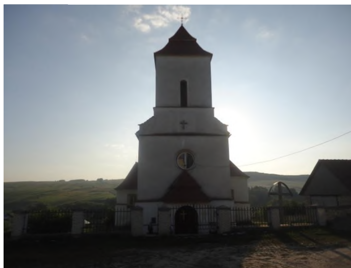
Іл.5. Костел Святого Станіслава Єпископа XIV–XVI ст., с. Липівка Рогатинського р-ну Івано-Франківської обл. Фото 2013 р.

У північній каплиці розкрито ранньоренесансний стінопис XVI ст. Фото 2013р.