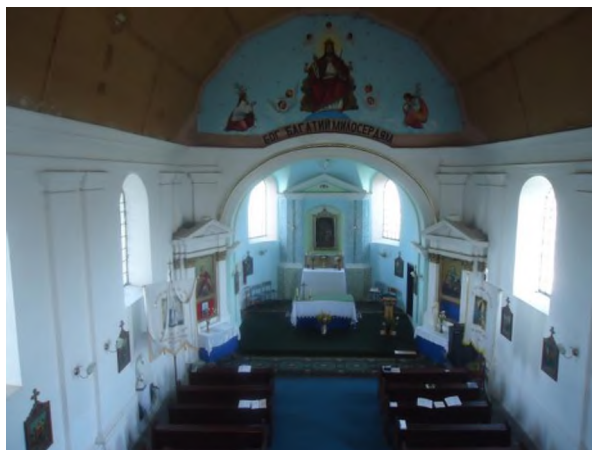
Іл.7. Костел Всіх Святих XVIII ст., смт. Букачівці Рогатинського р-ну Івано-Франківської обл. Фото 2013 р.