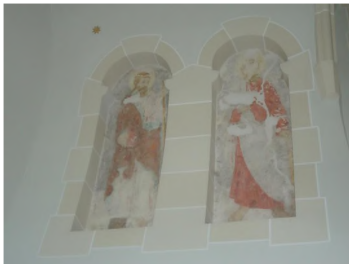
Іл.4. Святого Миколи Єпископа, місто Рогатин.

У північній каплиці розкрито ранньоренесансний стінопис XVI ст. Фото 2013р.