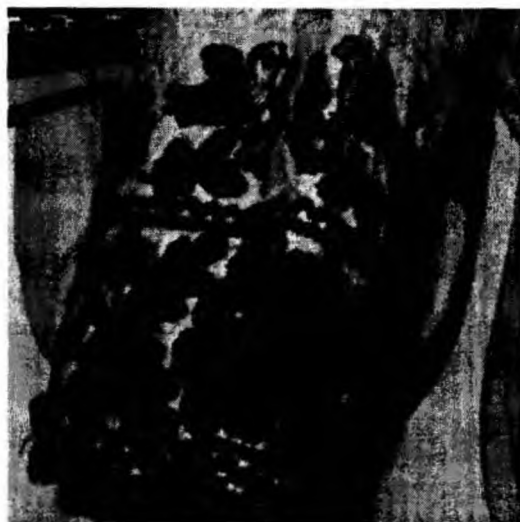
Рис.1. Зразок вишивки на жіночих сорочках, геометричний орнамент, зигзаги, мотив ромба с.Герасимів, Тлумацький р-н поч. XX ст.