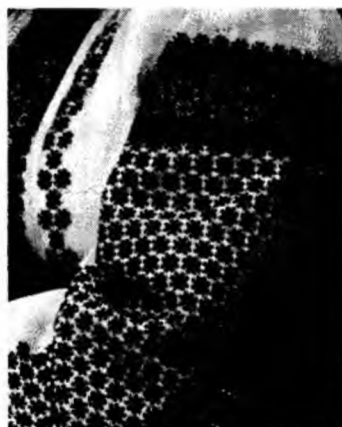
Рис.4. Тип узору вишивки на рукаві жіночої сорочки Городенківщина, серед. XX ст.