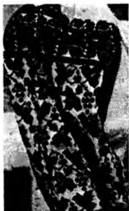
Рис.3. Фрагмент рукава жіночої вишитої сорочки з рослинним орнаментом с.Стрільче, Городенківщина, поч. XX ст.