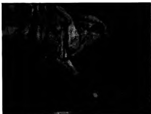
Рис.6. Орнамент вишивки на рукавах жіночої сорочки Городенківщина, поч. XX ст.

В статті проведено аналіз мотивів в покутському народному костюмі, розглянуто семантику кольору і засоби художньої виразності. Прослідковано зміни в декорі, орнаменті і виявлені семиотичні домінуючі в основних складових комплексу одягу.