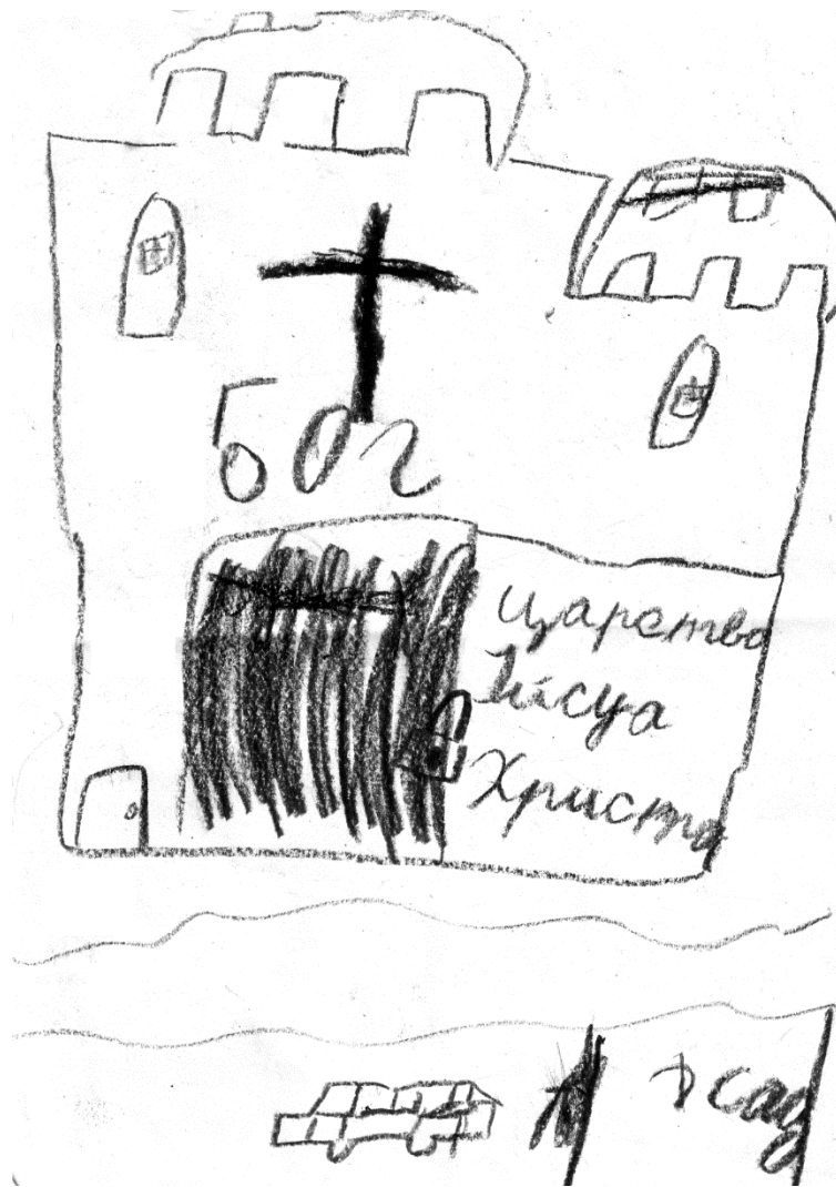
Рис. 2.1 Малюнок на тему «Світ, в якому я живу»

Автор малюнка восьмирічний хлопчик Андрій, батьки якого є адептами новітньої церкви харизматичного спрямування.