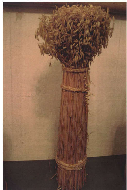
Фото 1. “Дідух”. Історико-краєзнавчий музей “Бойківщина” (м. Самбір)