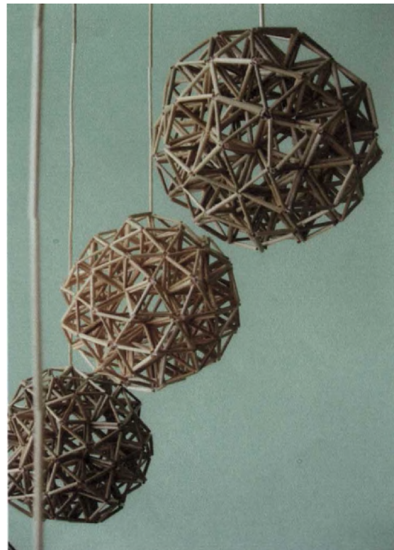
Фото 8. “Павуки”. Авт. Анна Безуглова (шкільний музей с. Купичів, Турійський р-н, Волинська обл.)