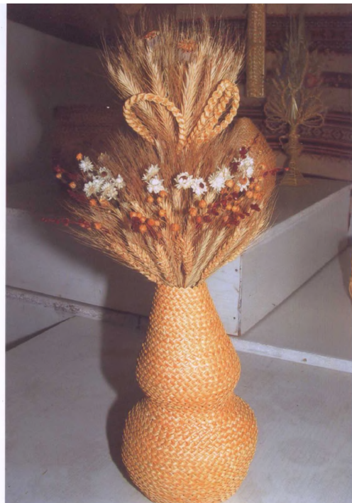
Фото 4. “Квітка”. Авт. М.Кравчук. Виставка “Житнє перевесло” (м. Івано-Франківськ, 2007)

У квітчанні осель річних релігійних і родинних свят є “квітка”. Розповсюджена пучками, букетами в селах та містах у житлових громадських приміщеннях, а також у церковній архітектурі краю. Укладена польовими букетами, пучками. Локалізована в різновидах форм давнини, обрядових (ритуальних) вінках. На Тернопільщині, Волині ставили сплетену з жита “квітку” або необмолочений сніп, який іще називали “дідух” [1, с.179]. Житня “квітка” є обрядовий вінок. “Плетений вінок з колосся – символ добробуту та плодючості” [3, с.160]. “До речі, на ритуальний сніп також напинали вінок і прикрашали його квітами. Сніп жита, або з жита вінок ставлять в головах молодих у першу шлюбну ніч” [там само].