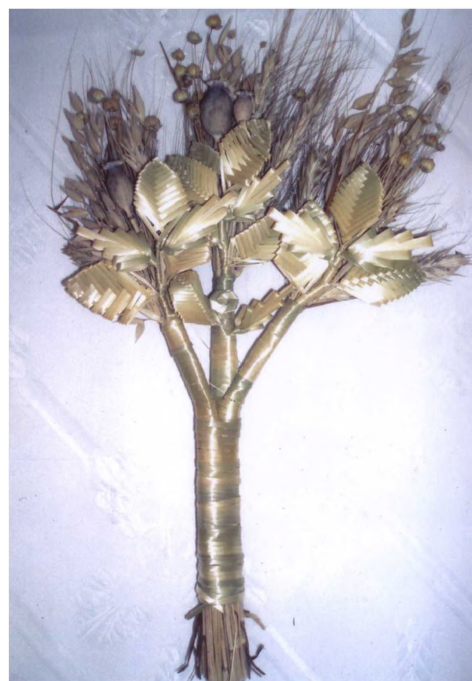
Фото 5. “Йорданська квітка”. Авт. Ю.Чічак (с. Небилів, Рожнятівський р-н, Івано-Франківська обл., 2009)

“У зимовий період свят на Поділлі крім вінка, ще плететься “квітка” – це п’ять чи шість окремих невеличких снопиків або пучків, сплетені разом в одну цілість, що зовні це все справді нагадує велику квітку” [4, с.222–223].