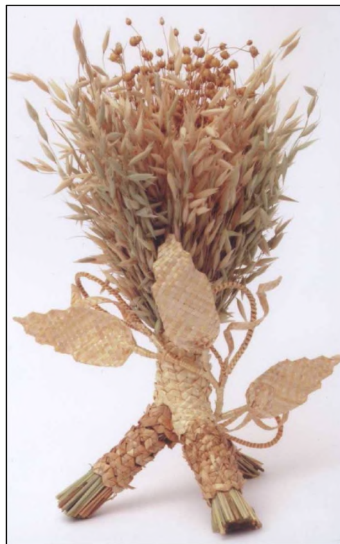
Фото 3. "Дідух". Авт. О.Мельник (м. Івано-Франківськ, 2010)

У сучасних умовах навчання за напрямом "Декоративно-прикладне мистецтво" обрядові солом'яні ви- робы поєднані традиційними й інноваційними техніками декоративних форм у синтезі матеріалів: паперу, лози, ниток, коралів, пір'я. Фігуративні новітні форми різних величин вівсяних (житніх) "дідухів"-триногів доповнені квітучими гілками з листям (фото 3), у техніках полотняного переплетення – розщепленими житніми стеблинами, які обвиті навколо стовбура до основи тринога. Інші – з пишними "вітами", поєднані в середині з пучками льону й солом'яною квіткою чи доповнені об'ємними формами пташок в аплікації соломкою (Інститут мистецтв Прикарпатського національного університету ім. В.Стефаніка, м. Івано-Франківськ). Однак міське ремесло в акцентах сучасних форм декору, з новітніми техніками візерункового плетіння, знівельовує обрядову функцію природних форм предківської давнини й у розвої декоративного мистецтва краю набуває сучасних напрямів розвитку та поширюються загалом.