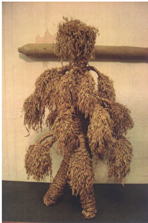
Фото 2. "Дідух". Історико-краєзнавчий музей "Бойківщина" (м. Самбір)

2009 р. З огляду розвою художнього плетіння, декорування злаками соломи, самодіяльні, народні майстри, художники декоративного мистецтва краю дедалі частіше поширюють свої ви- робы (твори) у монастирі та храми України. У типології обрядових церковних хоругв, ікон, митрополичих Панагій в аплікації соломкою, та плетених, в'язаних обрядових природних форм: "дідухів", ялинкових солом'яних іграшок, вишуканих віночків "квітки" християнської культури обрядових свят кінця ХХ – початку ХХІ ст.