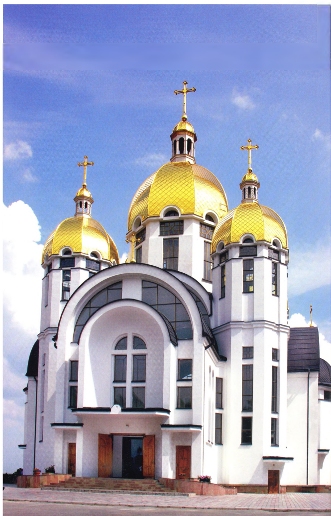
Рис. 1. Собор Зарваницької Богоматері. Автор проекту М. Нетриб'як. 2000 р.

Головний собор Санктуаріума – це хрещата в плані хрестово-купольна споруда, завершена п'ятьма банями, однефна й безстовпна. Вона відтворює традиційну архітектурно-планувальну структуру в українському храмобудуванні, але підкреслено виразну з урахуванням сучасних вимог. Характерний розкритий висотний і підпорядкований вертикальному пориву динамічний простір, завдяки ступенево-ярусному розташуванню склепінь (рис. 1).