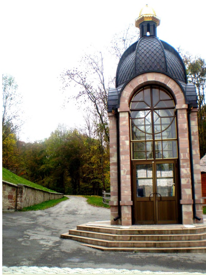
Рис. 4. Каплиця монаха

На захід від приджерельної каплички зведена ще одна. Вона квадратна в плані й постає у вигляді чотирьох цегляних стовпів, вільний простір між якими засклений. Баня каплички чотирипелюсткова, із сигнатуркою й хрестом. В інтер'єрі каплиці вміщено скульптурну постать монаха, що на колінах молиться перед чудотворною іконою (рис. 4).