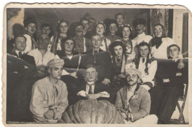
Акторський гурток. Драма в 5-ти діях Хмара. 12.12.1937 р