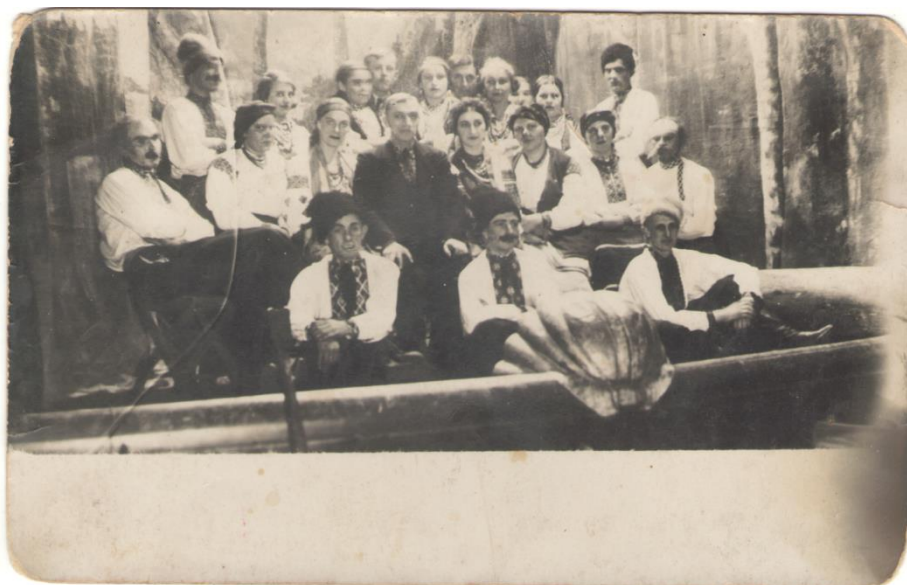
1933-1934 рр. Учасники невідомого дійства в Просвіті.