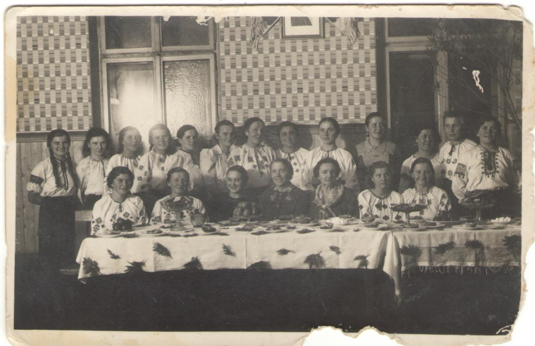
Випускниці курсів крою і шиття 15.01.1938 р.