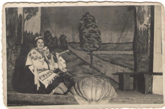
Акторський гурток. Драма в 5-ти діях Хмара. 12.12.1937 р.