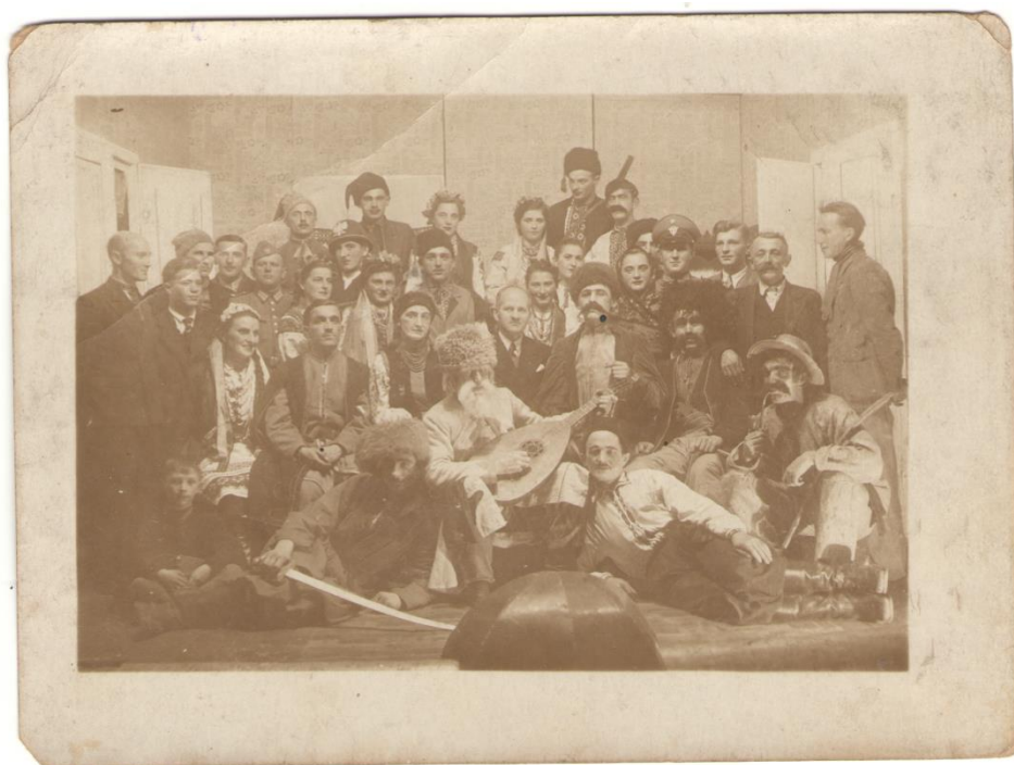
Відділ читальні Просвіту Надвірні 15.11.1941 р. вистава «Степовий гість»