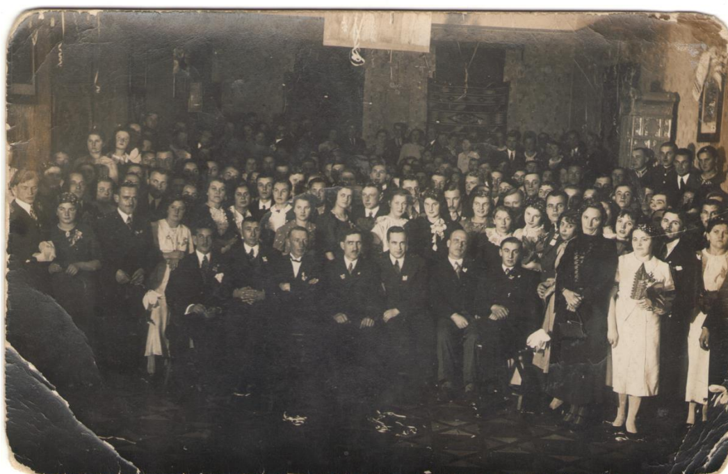
Свято Стрітєння у «Просвіті»