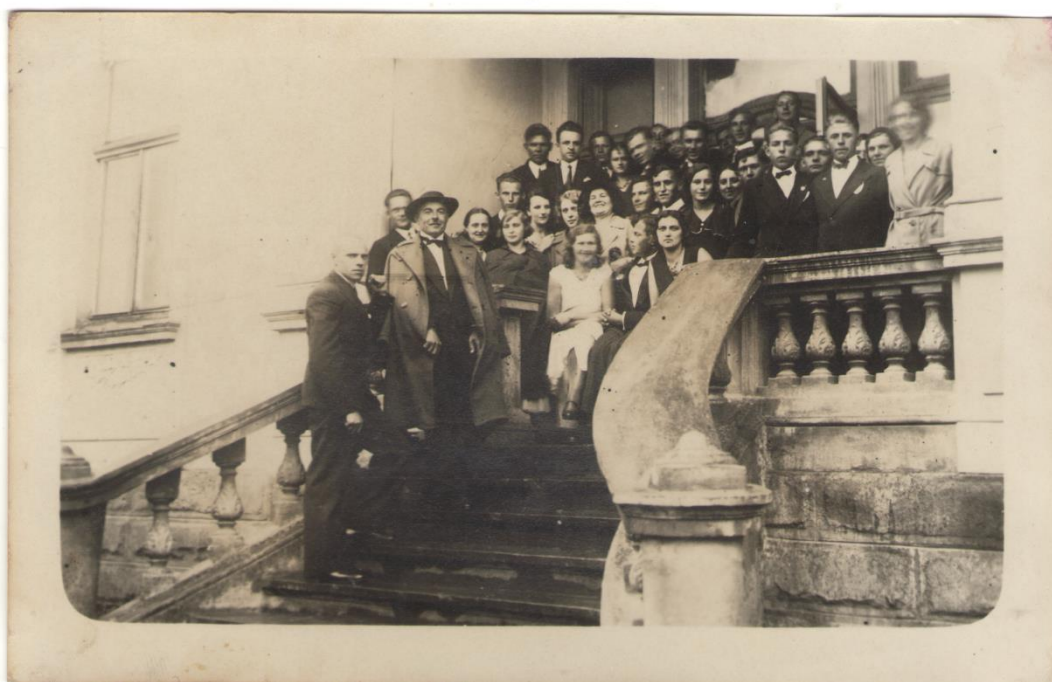
На сходах Просвіти