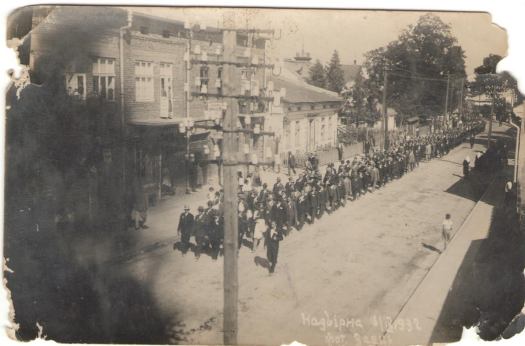
Кооперативне свято в Надвірній 18.09.1932