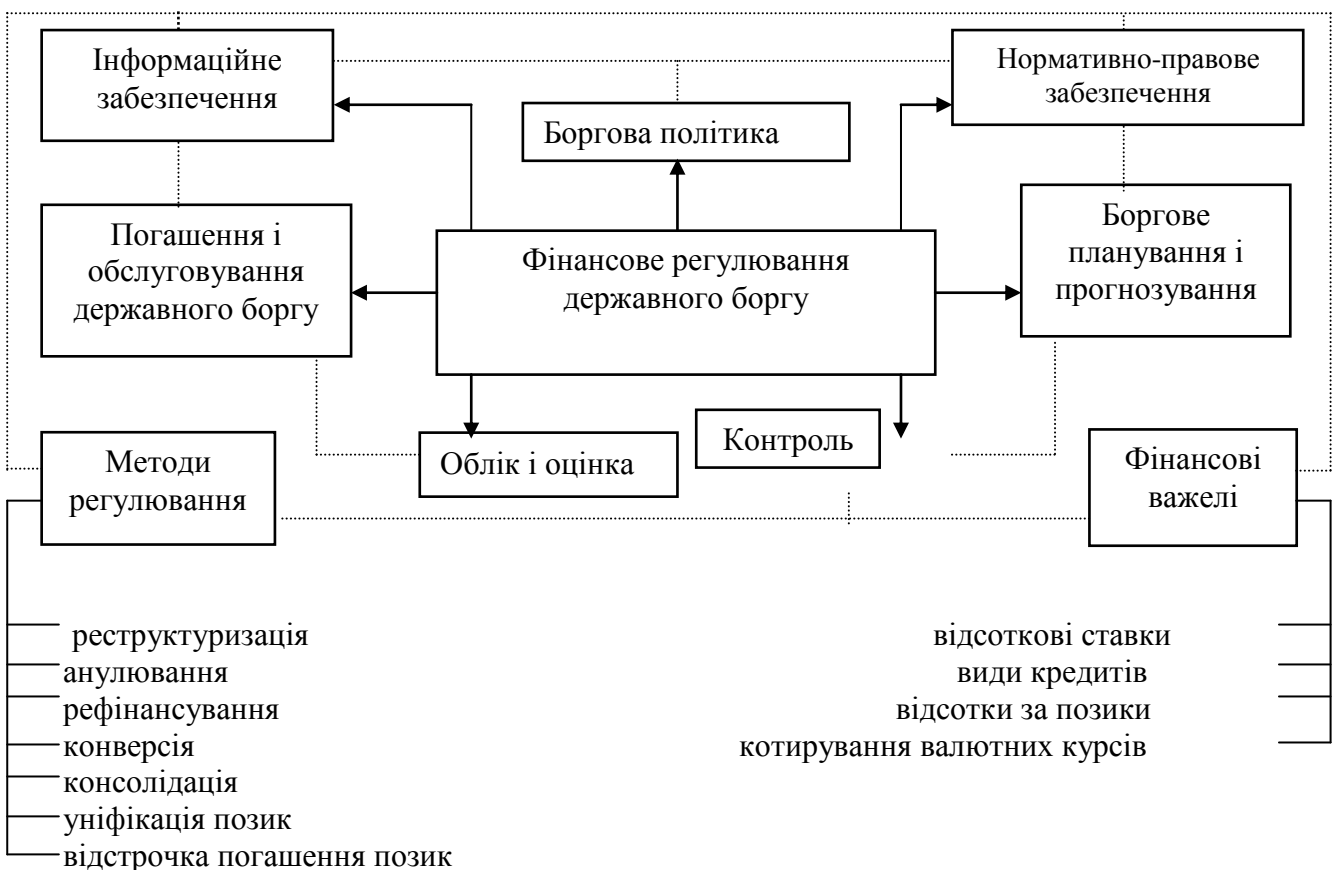
Рис. 3. Поелементна структура фінансового регулювання державного боргу

У загальному вигляді фінансове регулювання державного боргу містить наступні основні елементи: боргова політика, боргове планування і прогнозування, погашення і обслуговування боргу, облік і оцінка державних запозичень, контроль за використанням запозичених коштів, методи управління державними боргом, фінансові важелі, інформаційне, правове і нормативне забезпечення (рис. 3) [5].