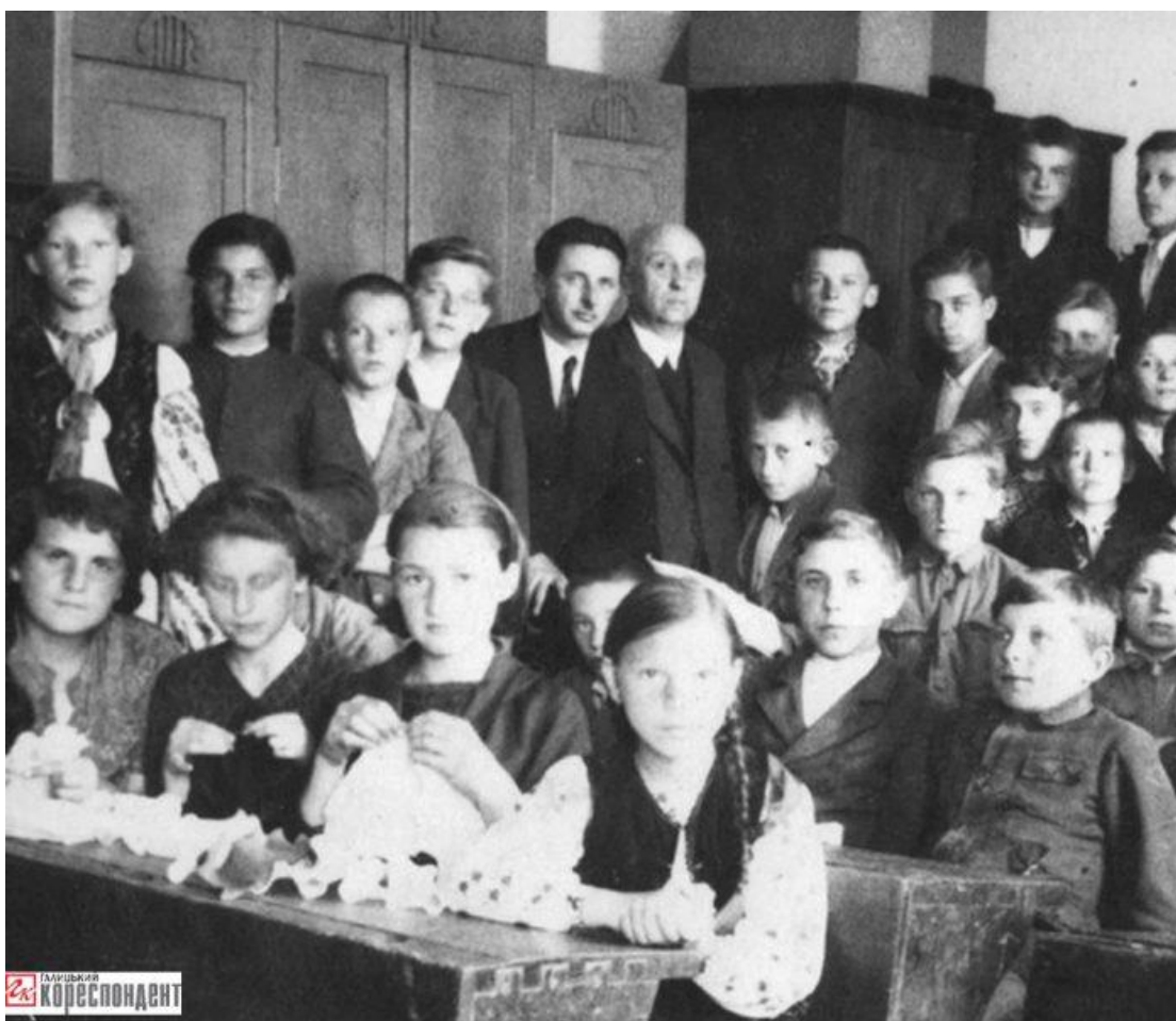
Кружок «Рідної Школи» ім. М. Шашкевича у Станиславові

URL: https://gk-press.if.ua/ridna-shkola-im-markiyana-shashkevycha/