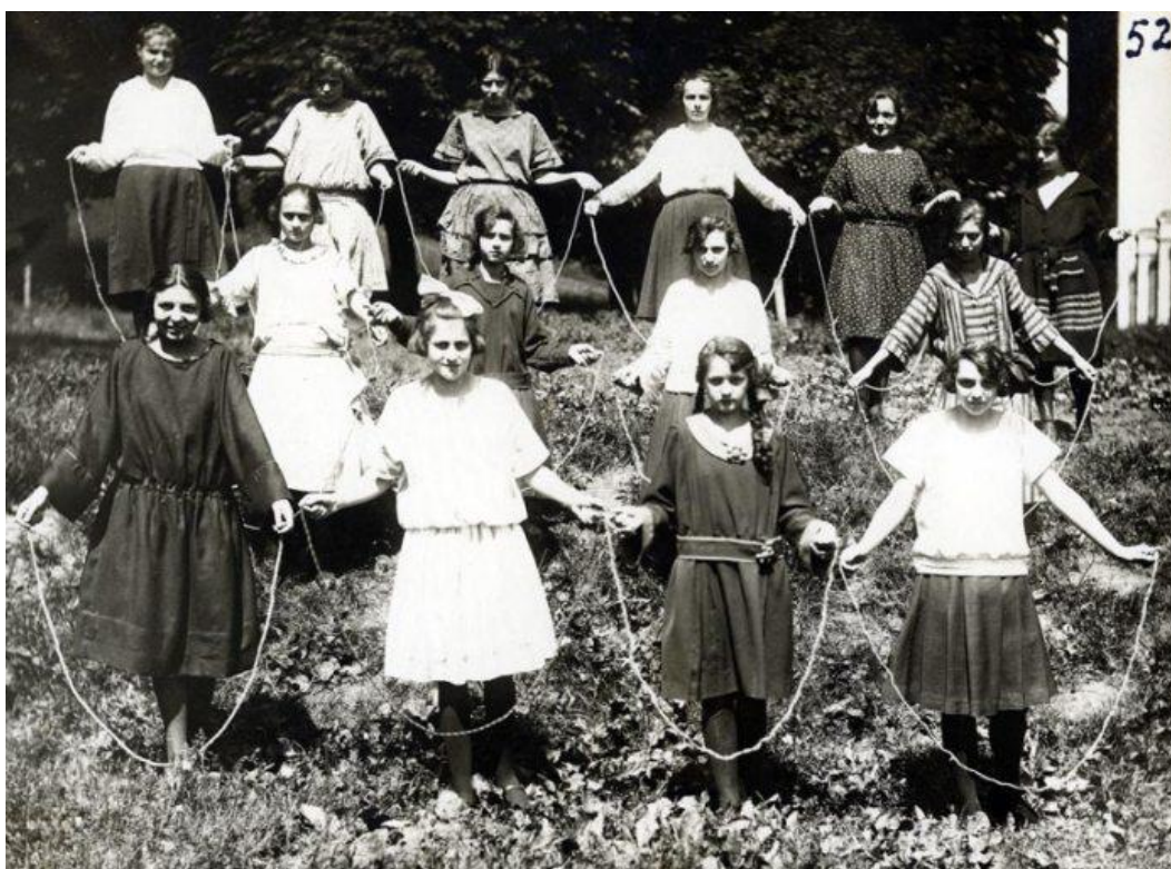
Учениці гімназії сестер Василянок під час виконання вправ зі скакалкою. Львів, 1920-ті роки