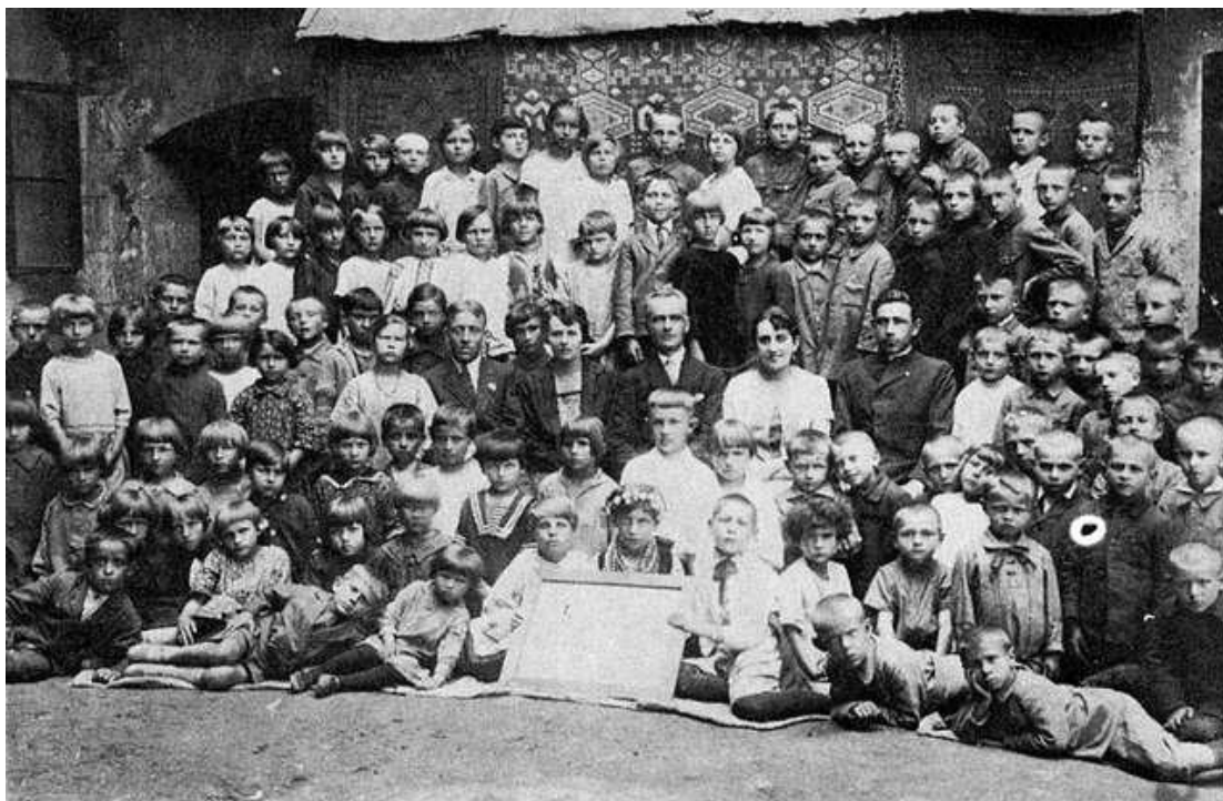
Гімназія Шептицького у Бережанах

URL: https://bastion.tv/pidpriyemnickij-hist-andreya-sheptickogo-abo-posriblena-sivinoyu-golova-kotra-dumala-pro-vsih_n41929