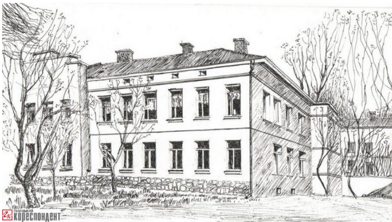
Будинок «Рідної Школи» в Станиславові. Мал. З. Соколовського

URL: https://gk-press.if.ua/ridna-shkola-im-markiyana-shashkevycha/