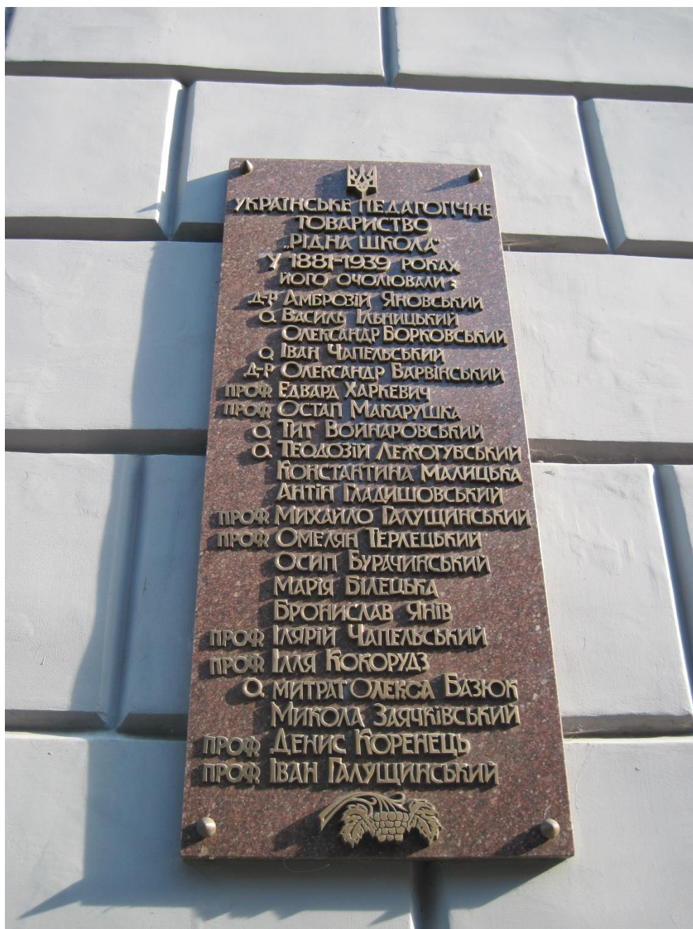
Пам'ятна дошка Рідної школи, Народний Дім, Львів, 2014