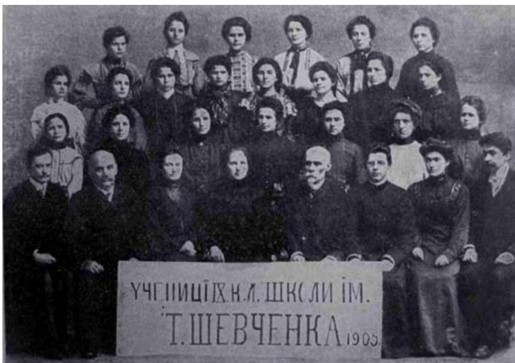
Учениці школи ім. Т.Шевченка 1905р.

URL: https://pedagogy.lnu.edu.ua/wp-content/uploads/2015/05/Ukr.pol.-chytannia.pdf