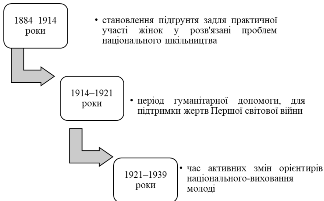
Схема 1. Стадії піднесення українського жіночого руху Галичини часу середини ХІХ століття – початку ХХ століття

Джерело: Івах С. М. Проблеми українського шкільництва у жіночому русі Галичини (80-ті роки ХІХ - 30-ті роки ХХ ст.) : автореф. дис... канд. пед. наук: 13.00.01. Прикарпатський національний ун-т ім. Василя Стефаника. Івано-Франківськ, 2007. 20 с.