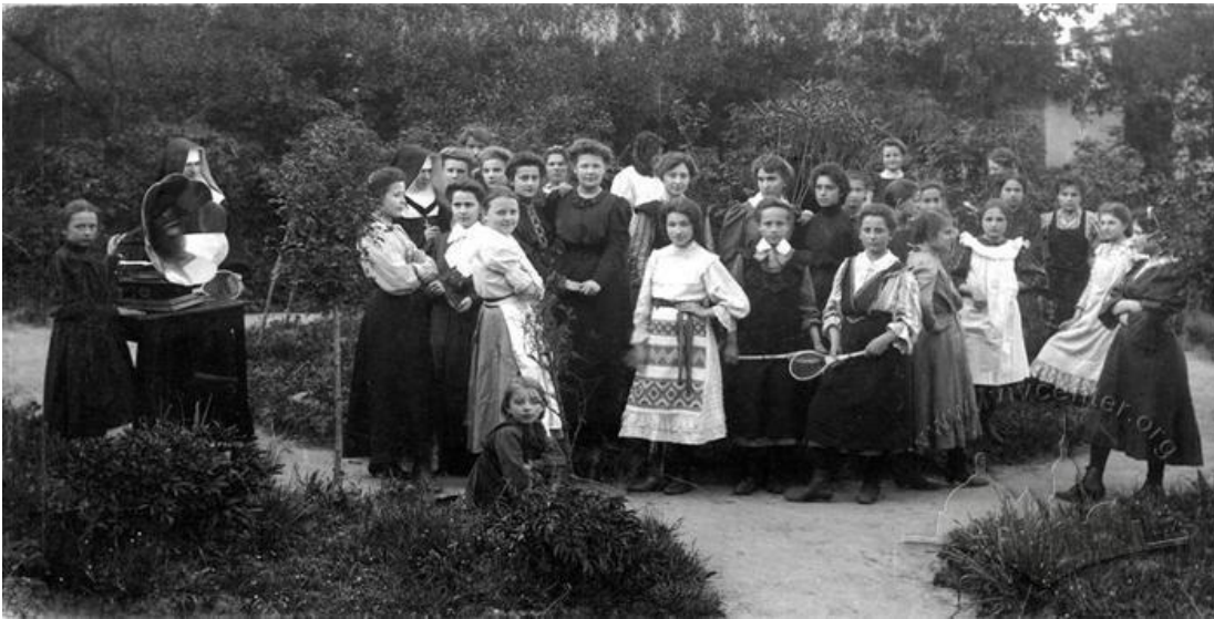
УЧЕНИЦІ ГІМНАЗІЇ ВАСИЛІАНОК

URL: https://uma.lvivcenter.org/uk/photos/1729