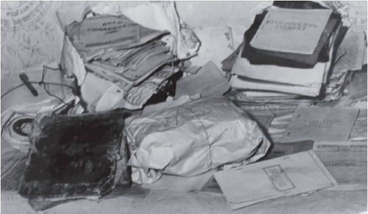
Фото документів Української народної партії (УНП), знайдених під час обшуку