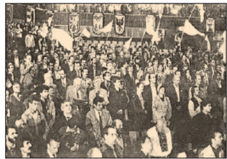
Установчий з'їзд Народного руху України за перебудову. Вересень 1989 р.

У жовтні 1990 р. відбулися Другі Всеукраїнські збори Народного руху. На цей час членами згаданої організації були 633 тис. громадян республіки, а про її підтримку заявляли 5 млн осіб. Учасники з'їзду схвалили документи, в яких