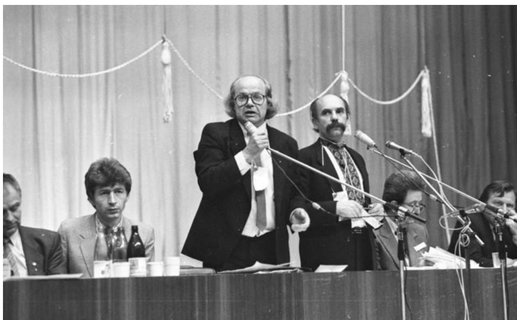
Голова НРУ поет і громадський діяч Іван Драч (у центрі)