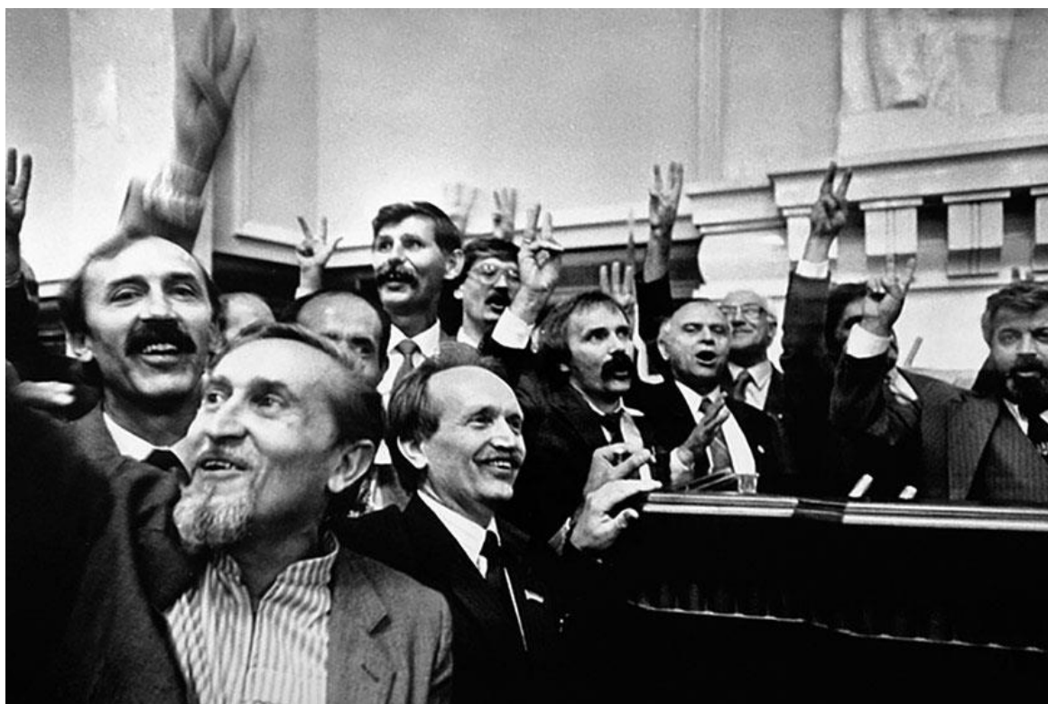
Проголошення Незалежності – момент голосування