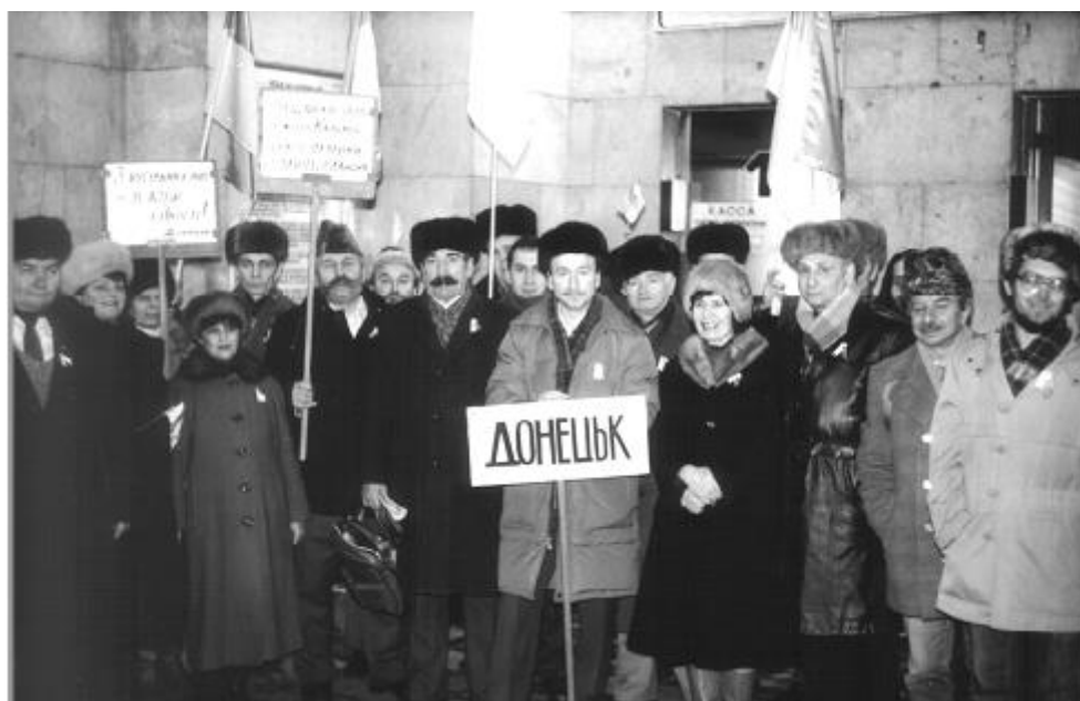
Донецька делегація на акції «Живий ланцюг єднання», 21 січня 1990