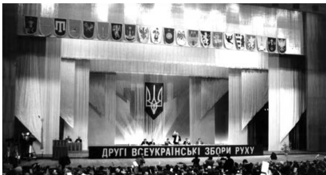
Проведення II зборів Руху