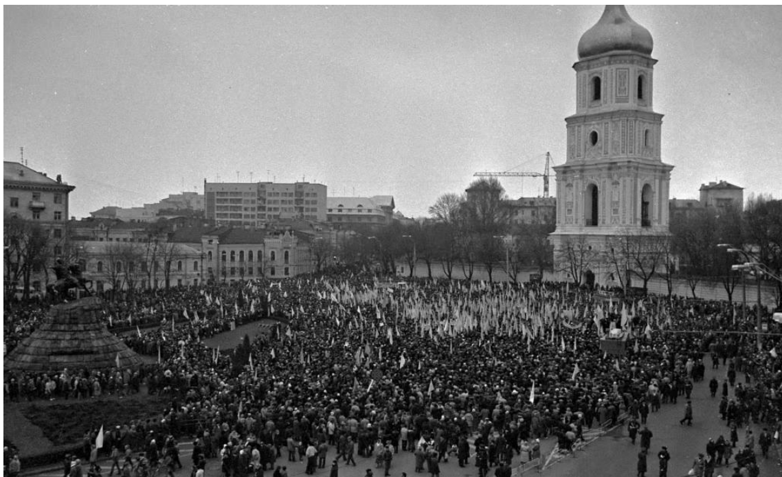
Мітинг у столиці України на Софійському майдані (тоді – площі Богдана Хмельницького) після завершення «Живого ланцюга» в рамках відзначення Акту Злуки УНР і ЗУНР в 1919 році. Київ, 21 січня 1990 року