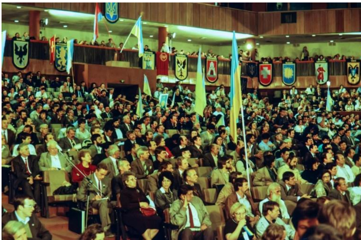
Установчий з'їзд Народного руху України у конференц-залі Київської політехніки