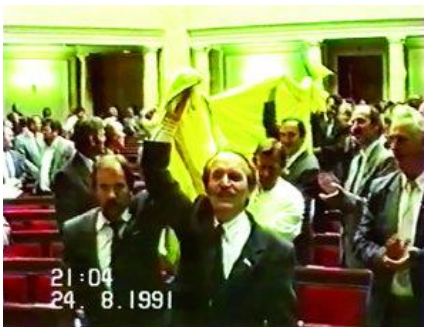
Історичне внесення прапора в сесійну залу Верховної Ради