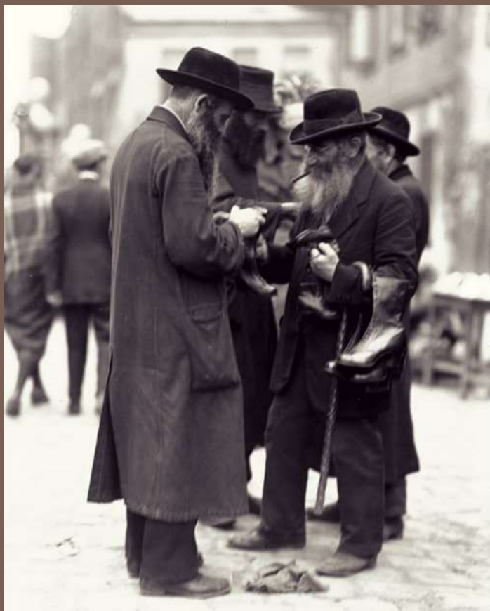
„Inne a/nie swoi”: wspólnota żydowska

Żydzi mogli integrować się z jakimikolwiek środowiskami. Adaptacja polegała na tym, że Żydzi dobrze znali języki i dialekty regionu, lokalne tradycje i obyczaje, psychologię otoczenia. Dość elastycznie reagowali na zmiany politycznej i rynkowej koniunktury, przystosowywali się do wymogów przyjmującego społeczeństwa i osiągnęli doraźne sukcesy w realizacji własnych interesów i nawet w wejściu do elity regionalnej. Podstawową wartością kultury politycznej Żydów galicyjskich był kolektywizm .