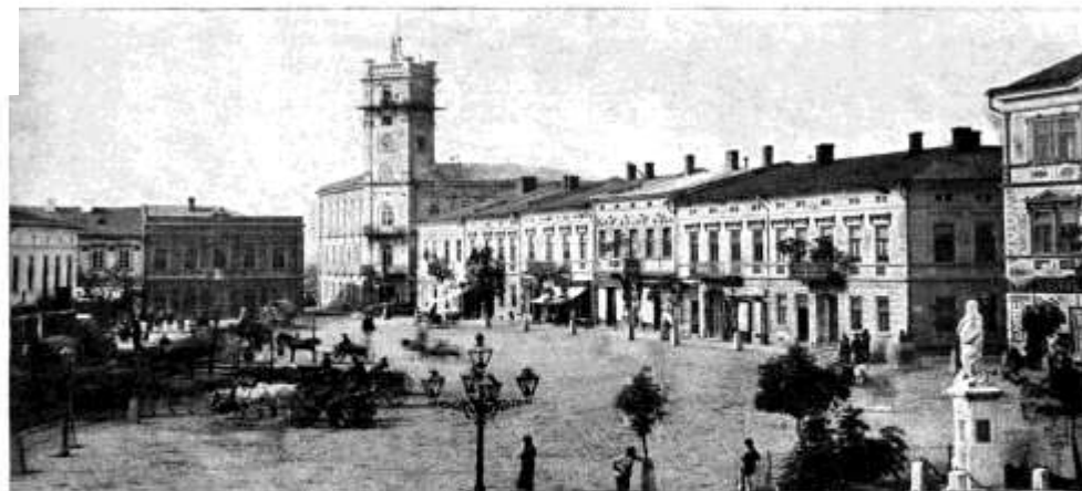
RYNEK I RATUSZ W KOŁOMYJ.