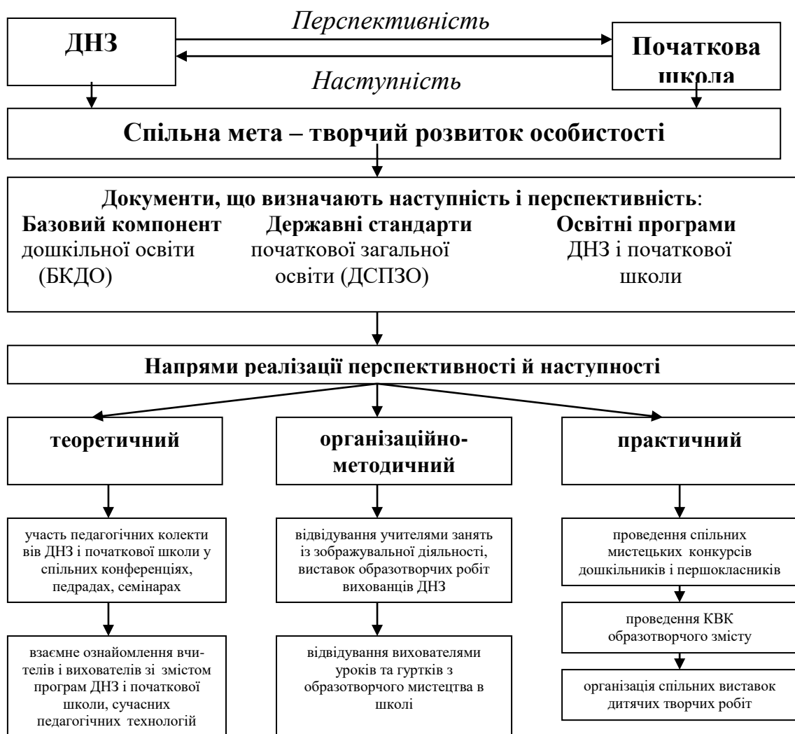
Рис 3. Структурна модель перспективності й наступності в організації образотворчої діяльності в ДНЗ та школі

2. У розгляді означеного питання слід використати рисунок 3 задля систематизації роботи навчальних закладів з реалізації принципів наступності й перспективності та їх основних напрямів. Відповідно, до програм навчання і виховання у ДНЗ і початковій школі одним із пріоритетних завдань означено творчий розвиток особистості дошкільника і молодшого школяра засобами образотворчого мистецтва.