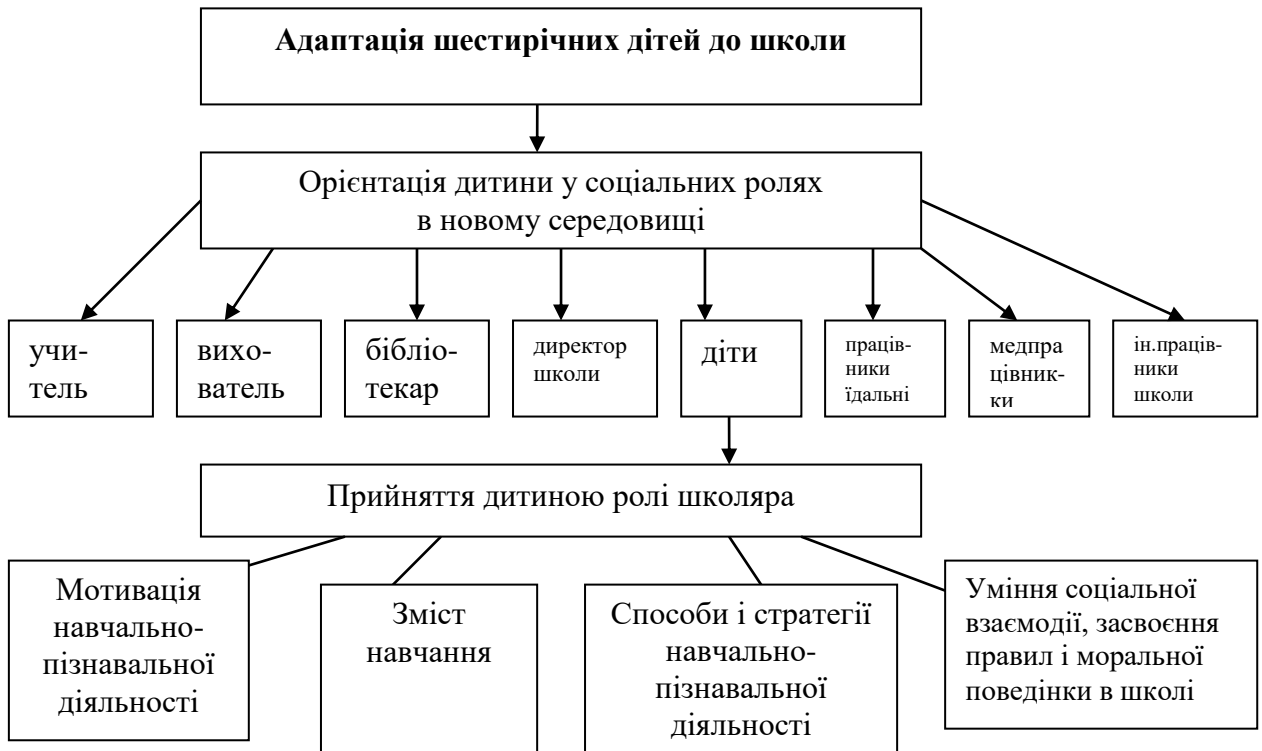
Рис 1. Адаптація шестирічних дітей до школи

Критерієм нормальної адаптованості дитини до шкільного навчання є її позитивне ставлення до школи, розуміння пояснюваного вчителем навчального матеріалу, самостійність, здатність зосереджувати увагу під час виконання завдань, охоче виконання громадських обов'язків і доброзичливе ставлення до однокласників.