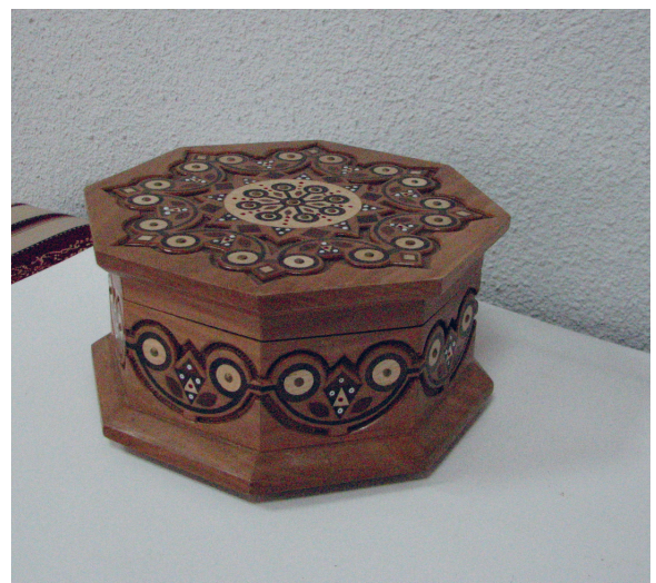
Творчі роботи вихованців Малої академії народних ремесел, м. Галич.