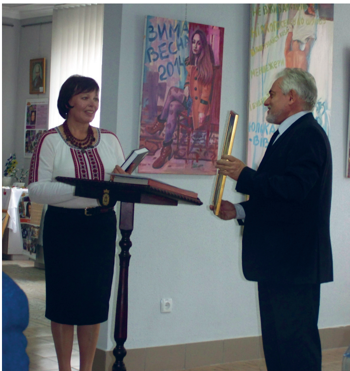
Професор Богдан Тимків вітає з 25-ти річчям заснування Галицької дитячої художньо-ремісничої школи (сьогодні Мала академія народних ремесел), 2015 р.