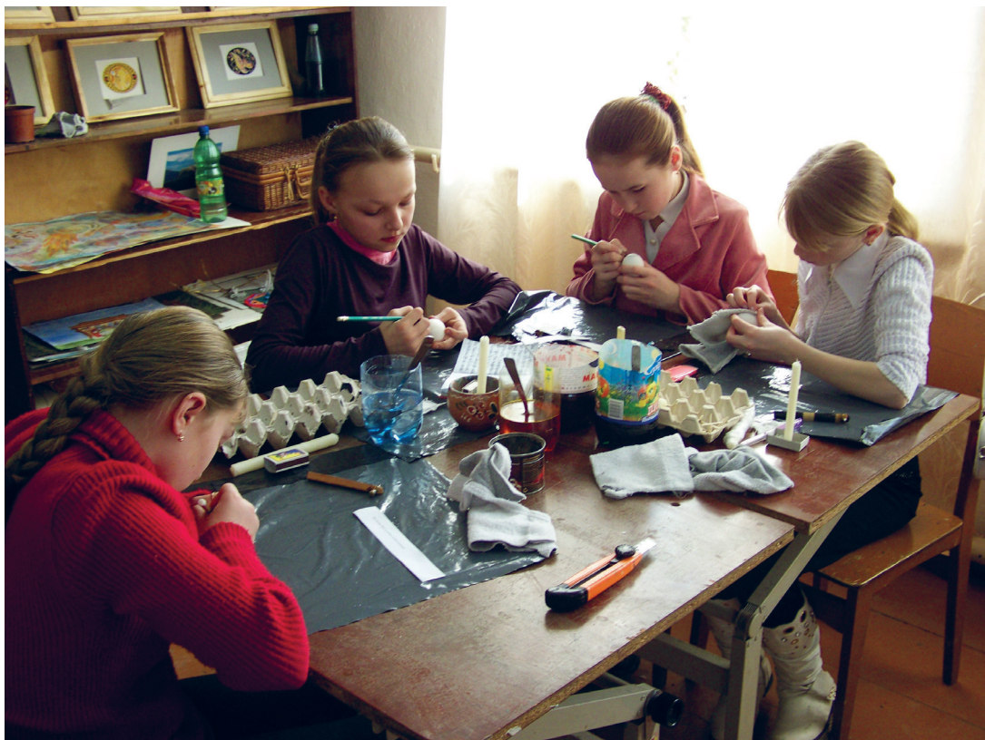
Під час занять гуртка з писенкарства.