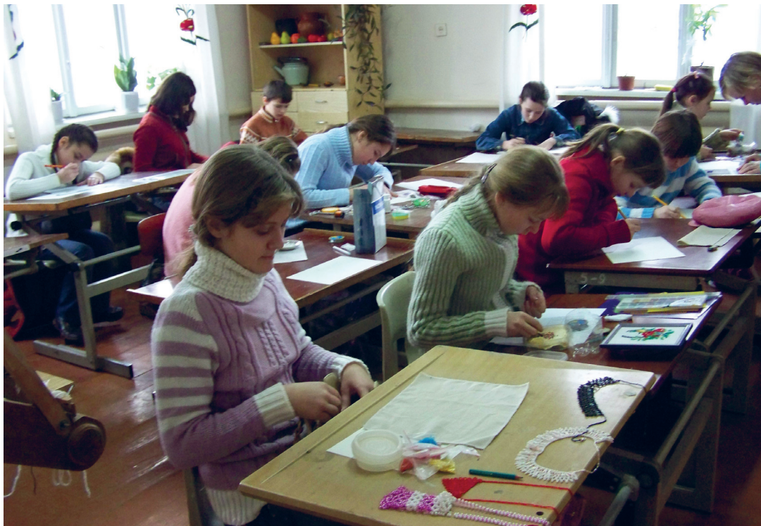
Заняття гуртка бісероплетіння.