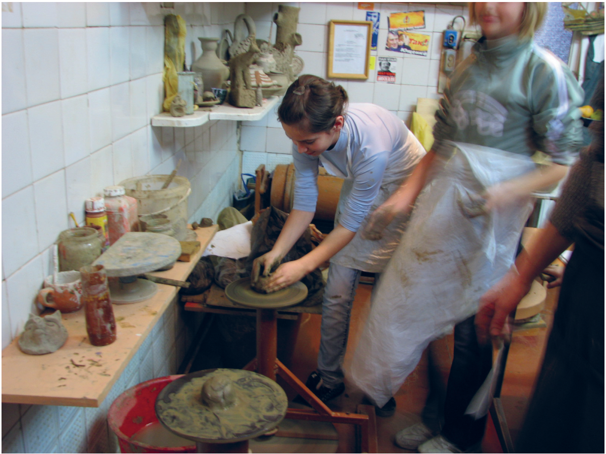
Під час занять гуртка з художньої кераміки.