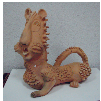
Творчі роботи вихованців Малої академії народних ремесел, м. Галич.