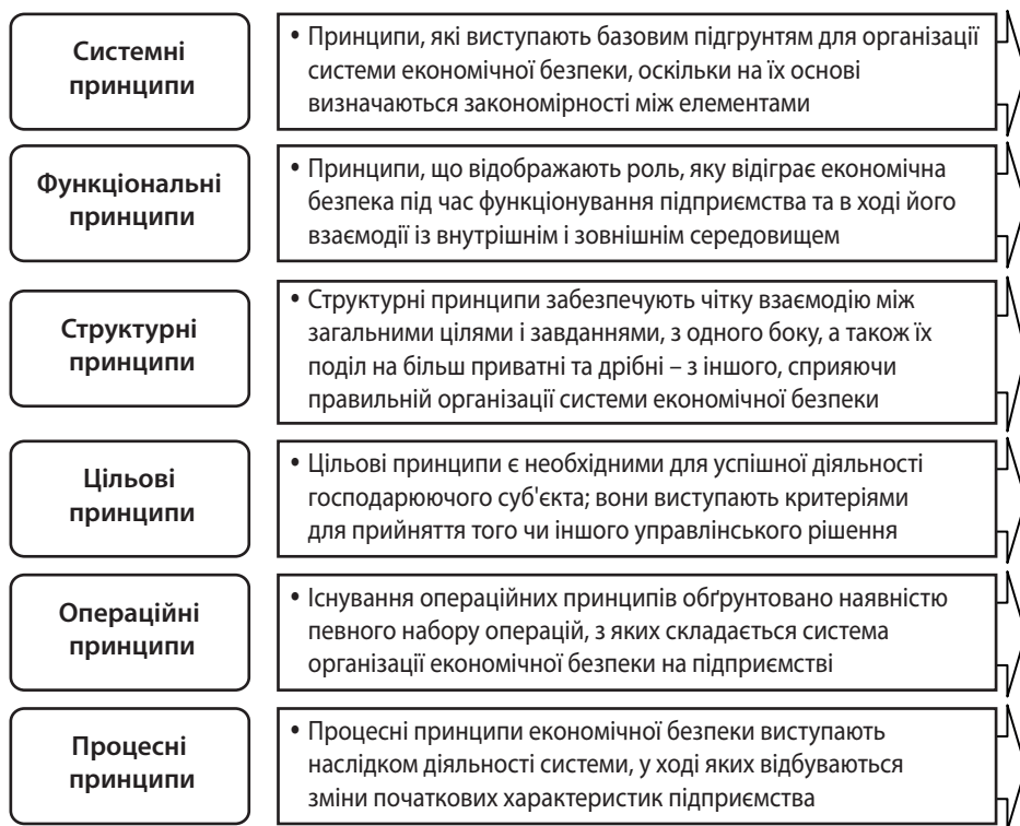
Рис. 3. Групування принципів організації економічної безпеки на підприємстві