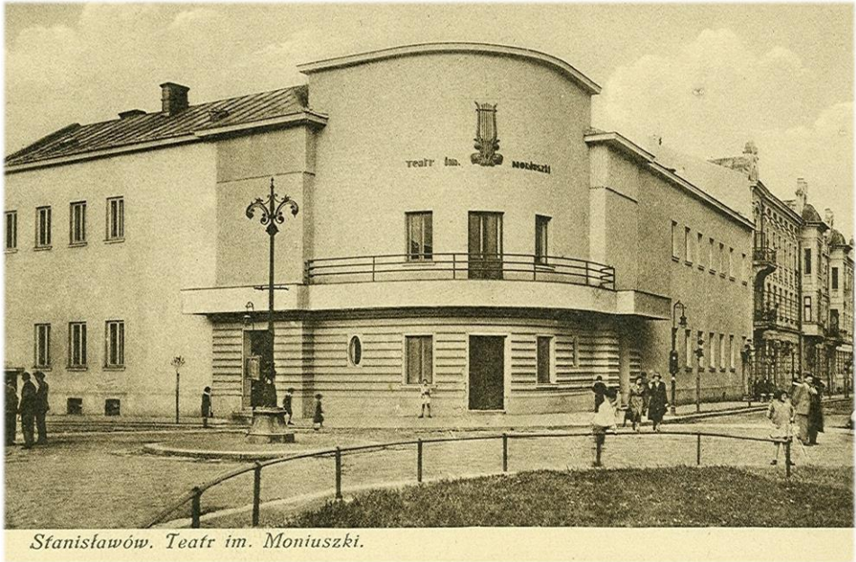
Stanisławów. Teatr im. Moniuszki.

Приміщення обласного музично-драматичного театру імені Івана Франка (колишній театр ім. С. Монюшка)