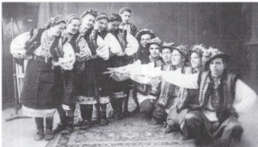
Гуцульський балет під керівництвом Ярослава Чуперчука