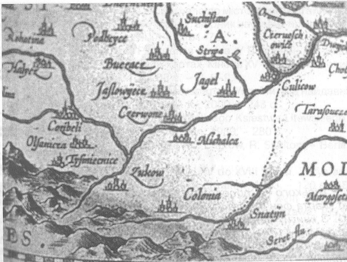
Уривок карти «Опис Польщі і Литви автора Вацлава Гродецького і коректора Андрія Пограбки пілзненського» (Антверпен, 1602 р.), де позначена Тисмениця. З книги: Вавричин М. Україна на стародавніх картах. – Кінець ХV – першої половина ХVІІІ ст. / М. Вавричин, Я. Дашкевич, У. Кришталович. – К.: ДНВП «Картографія», 2004. – 208 с. – С. 102–103.

Вагомий внесок у справу дослідження і популяризації постаті цього видатного сина тисменицької землі зробив наш земляк професор Ігор Андрухів. «Не було серед українського громадянства Галичини, – писав він, –