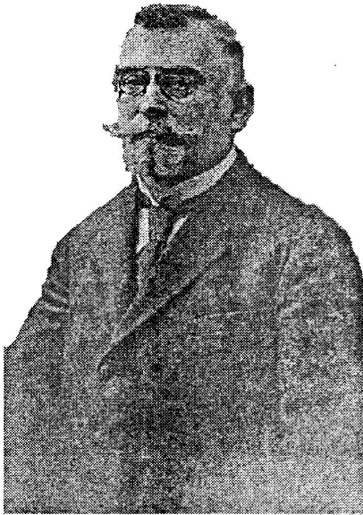
Кость Антонович Левицький (18 листопада 1859—12 листопада 1941)

юристів, яким допомагав здобувати фахову освіту шляхом читання рефератів, організації наукових дискусій, формування власної бібліотеки тощо.