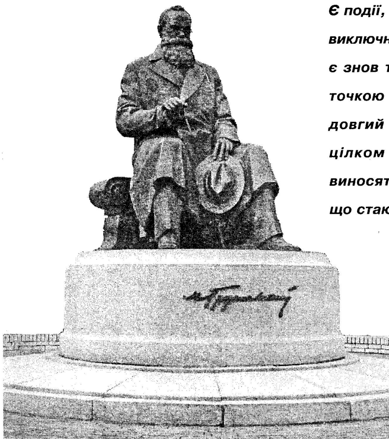
Пам'ятник Михайлу Грушевському. м. Київ

№ 9—10 (745—746), березень, 2012 / видається з 1 вересня 1996 року 4 рази на місяць