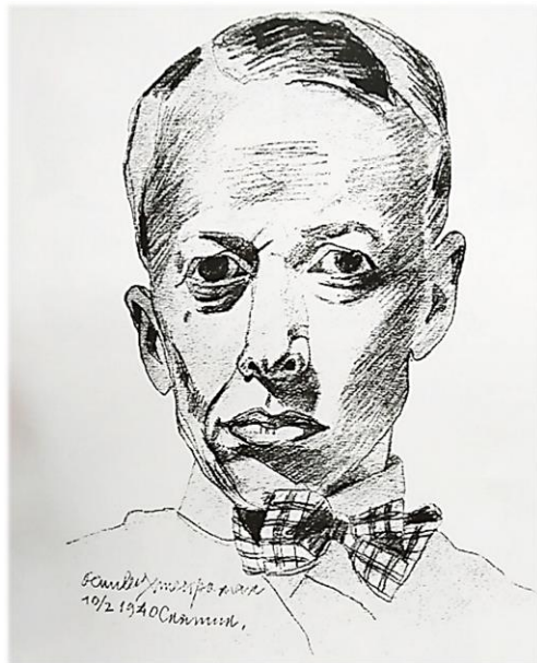
Осип Сорохтей. Автопортрет (1940)