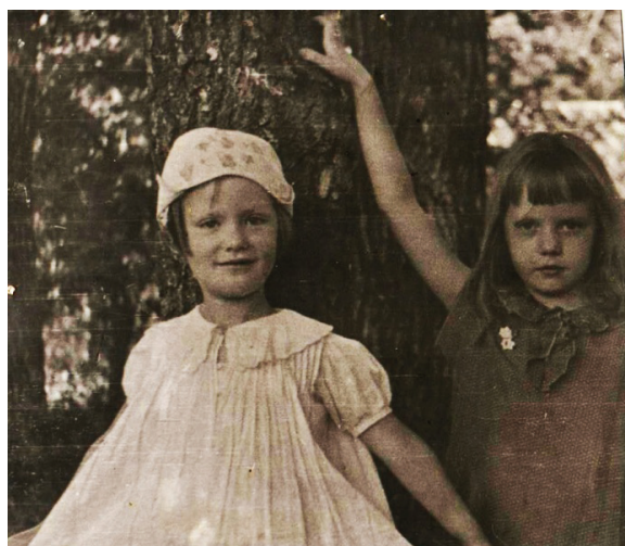
Первая пол. 1940-х годов. Самара.