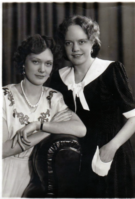
1953–1954 годы. Киев.