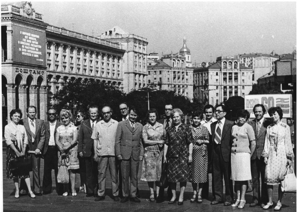
Колектив Інституту літератури ім. Т. Г. Шевченка НАН України