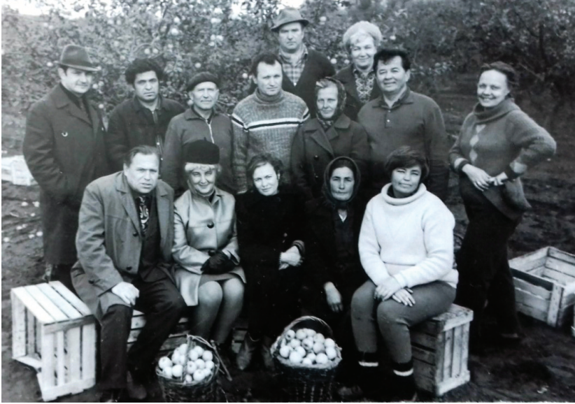
1973 рік. Радгосп «Хмельовик», с. Баришівка Київської обл.