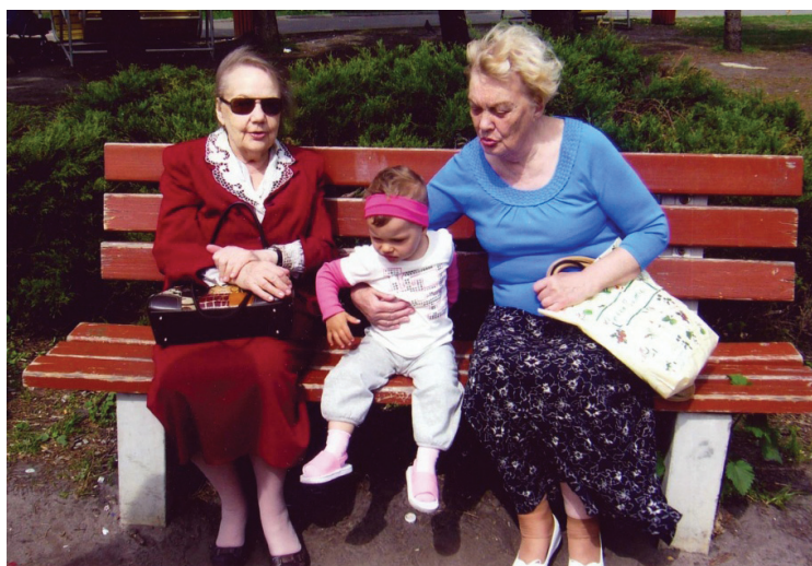
2010 год. Киев.