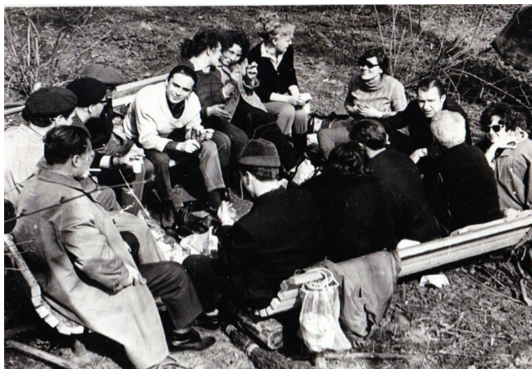
Конец 1960-х – начало 1970-х годов.