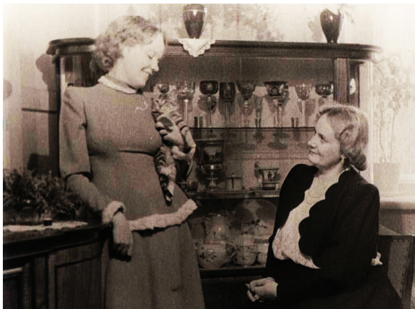
Середина 1950-х годов. Киев.