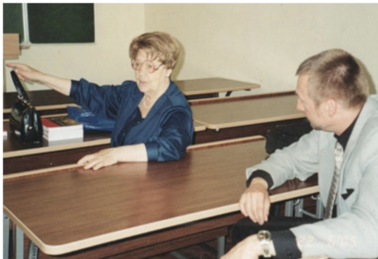
22 червня 2005 р. Київ. Корпус філологічного факультету Київського національного університету імені Тараса Шевченка. На Міжнародній конференції «Мова і культура»

Для мене сутність постаті Наталії Ростиславівни визначається двома чинниками. Перший – це безмежна доброта у ставленні до людей. Я ніколи не чув від неї жодного поганого слова про когось, навіть якщо хтось такого слова заслуговував. Вона спиралася в оцінках людей тільки на все добре, позитивне, яким би малим воно не було. Багатьом це могло здаватися наївністю, довірливістю. Та це насправді було не так. Наталія Ростиславівна кожного дня свого великого життя, думкою і вчинком сповідувала те, про що влучно казав у своєму останньому інтерв'ю кінця травня 2010 року (вона періодично нагадувала мені це висловлювання) її близький друг, однокурсник її чоловіка, доктора філософських наук, професора Володимира Івановича Мазепи (1930–2003), український філософ, доктор філософських наук, професор Сергій Борисович Кримський (1930–2010): «Людину потрібно зрозуміти. А це означає, що її треба прилучити до власного досвіду, до самого себе. Це особливий стан, коли ви ставитеся до людини, як до частини самого себе. Дуже важливий педагогічний висновок зробив Гете: “Якщо ви будете ставитися до людини як до такої, якою вона є насправді, то вона стане гіршою, ніж вона є. А якщо будете ставитися до неї як до такої, якою вона повинна бути, то вона стане такою, якою може бути”. Це особливий педагогічний напрям, який виходить з ідеї святості особистості» [3].