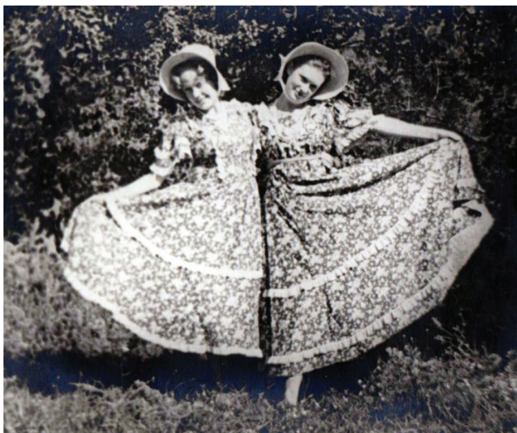
1951 год. На даче в с. Звонковое Васильковского р-на Киевской обл.